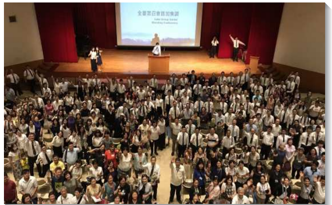
▲ 路加聖徒集調合影

二、醫界聖徒的生活—職場，交通到如何兼顧職場生涯與全面平衡的召會生活。由擔任醫學院系主任多年的路加弟兄分享基督徒如何兼顧教學研究與召會生活，弟兄細細數算在職場生活的每一階段裏，主如何為他編上金辮鑲上銀釘，將神生命做到他裏面。也有弟兄從老年醫學『活躍老化』的新觀念，帶進主對得勝者的呼召，鼓勵召會壯年以上的聖徒都能像摩西、雅各一樣，追求生命的成熟，幫助、成全下一代，並祝福下一代。不僅是老有所終，更是老有所『用』。另一位來自花蓮玉里的聖徒，她邀請職場上剛得救的小羊參加路加集調，小羊首次在眾人前作見證，就剛強的說出在玉里小鎮沒有