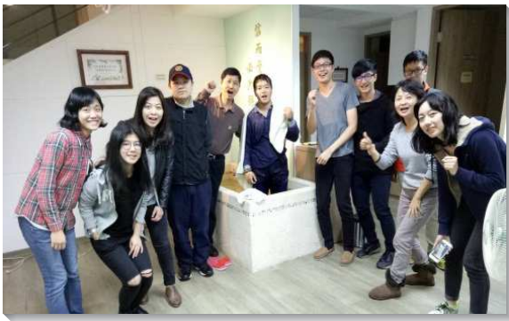
▲聖徒積極傳福音帶人得救

一、聖徒們於每週二下午固定到校園傳福音，養成接觸人的習慣。外出前先到會所與同伴追求福音信息，被主話充滿並挑旺靈，再有充滿靈、讚美基督得勝的禱告。我們出外湧流神聖的生命，神為我們加添