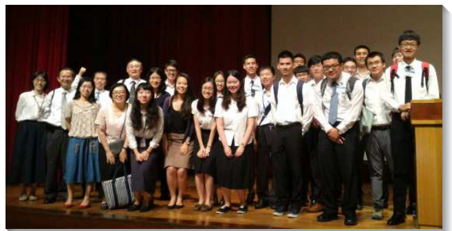
▲ 學生與在職聖徒參加路加集調

三、醫界聖徒的行動—全地，說到聖徒如何預備海外開展。聖經中路加是保羅親密的同工（西四14）。他從特羅亞開始加入保羅的行程，保羅三次的開展都有路加同行，他與保羅一同坐監（門一24），甚至當保羅殉道的日子臨近，保羅也說，獨有路加同我在一起（提後四11）。所以路加不是在一處定點生活的醫生，而是一位緊緊跟隨職事，陪同保羅往外開展的同工。