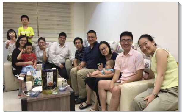
▲聖徒開家開排，彼此牧養

此外，弟兄們也鼓勵聖徒每週陪人家聚會，有確定的餵養對象，幫助新人在神聖的生命上長大。為著將聖徒帶進草場以得牧養並前去餵養人，就需要建立普