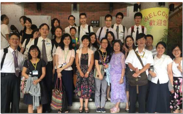
▲ 北市聖徒參加路加集調

本次路加集調的主題：醫界聖徒的養成、生活、與行動。有三大子題，並以這三大子題來呈現信息、見證與分享，滿了新樣。養成，著重在校園生活，以奉獻為蒙恩的起點。生活，著重在職場的榜樣，由在職的醫界聖徒分享如何兼顧職場生涯與全面平衡的召會生活。行動，醫界聖徒在全地的行動，以路加緊緊跟隨保羅開展的榜樣，鼓勵聖徒積極預備海外開展。每子題的分組時間都事先邀請三位醫界聖徒做專題分享，接著再有彼此問互相答的交通。