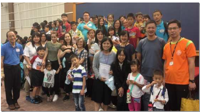
▲親子一同參加健康生活園

一位姊妹帶大兒子和小女兒參加，哥哥今年第一次當實習隊輔，他在嚴格的隊輔訓練中非常經歷主，原先還猶豫是否要繼續參加去服事幼童，然而在過程中，他一再看見自己的不足，更需要有穩忍深的性格。未了兒子感謝媽媽堅定持續年年帶他參加，使他有資格成為實習隊輔，明年他還要來服事。妹妹也宣告每年都要參加親子園，以後能像哥哥一樣成為隊輔服事人。我們願意奉獻年年都參加親子健康生活園，願主祝福更多的家操練過神人家庭生活，和孩子一起愛主、經歷主並服事主。（呂熊詩芹）