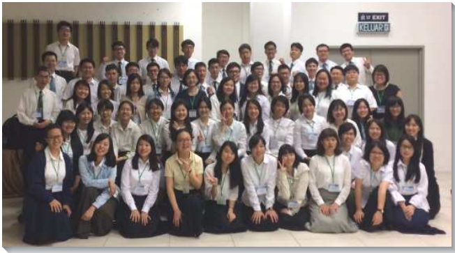
▲大學聖徒參加亞洲國際大專訓練

亞洲國際大專訓練去年首次舉辦於臺灣，今年第二次於七月二十三至七月三十日在馬來西亞古晉召會舉行。有來自台灣、中國大陸、香港、韓國、菲律賓、馬來西亞、新加坡、印尼、越南、泰國、印度和美加地區共八百三十位大學生參加。眾人一同進入二〇一七年夏季訓練以西結書結晶讀經（二）的信息。聚會全程，無論是信息、分享、禱研背講、考試等，都以英語進行，使亞洲各地大專生一同進入基督身體的相調交通。特會後，各國聖徒們分別到吉隆坡、美里、古晉、詩巫等地，有三天的訪問召會與相調。