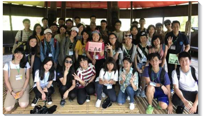
▲大學聖徒於訓練後訪問召會

會中，弟兄們交通了當前主在亞洲和歐洲的行動，學生們看見各地都有一班清心愛主、追求主的青年人，為主花費和擺上，這使學生們的眼光不再停留在自己所居住的地方，更是被擴大能夠看見祂在全地的需要。特別是亞洲，乃是六大洲當中人口最多的，而福音卻最不普及，也是我們最容易到的地區。主正在呼召一班青年人能夠為著祂的需要，奉獻自己。因此，我們需要擺上我們的禱告，奉獻財物和全人，前去各地開展，有分主的行動，把主迎接回來。