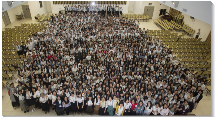
▲各國聖徒參加亞洲國際大專訓練合影

訓練後，包含台北的弟兄姊妹，有三百五十位聖徒繼續留在古晉召會相調訪問，在第一個晚上的相調聚