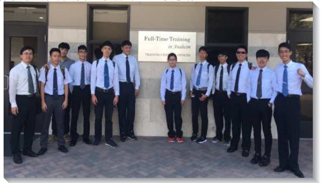
▲青年聖徒赴海外訪問召會

美國和加拿大的聖徒也見證，學生們的參訪所帶給他們的祝福。一位在加拿大的弟兄分享，去年他在接待學生之前光景下沉，但看見弟兄們每早晨簡單的呼求主名，他就得復甦，他的兒子也受吸引，參加真理學校，並且熱切愛主。他們全家因為接待，得著了主奇妙的轉變。另一位在美國的弟兄說到他在三年前遇到建中的弟兄們，看見弟兄們無論是禱告、唱詩、分享，都充滿火熱的靈！這樣清心愛主的光景大大的激勵他，使他也切慕作一個愛主、享受主的弟兄。讚美基督的身體何其豐富，感謝聖徒的扶持，將青年人送到海外訪問召會，實在是太有價值了！（范士育）