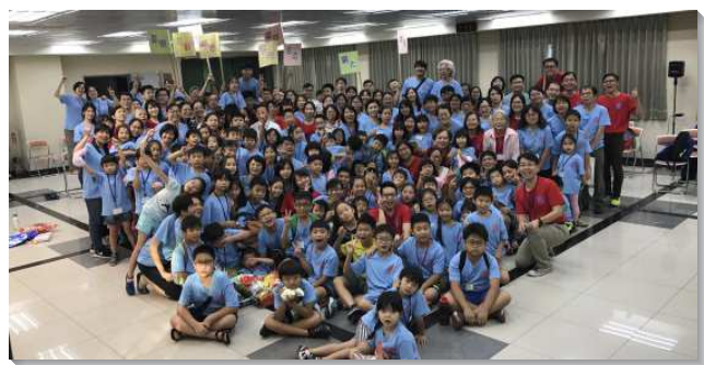
▲信松港湖區親子健康生活園於忠義會所

親子們在精心設計的活動過程中體認性格的重要。未了的展覽聚會中，有家長見證，參加親子健康生活園是全家最快樂的時光，父母和兒女為了課程先有預備，早早在家中練唱詩歌、背聖經，使得家中氣氛和樂。有位家長希望女兒，在聚會中能坐有坐相，孩子一直不願配