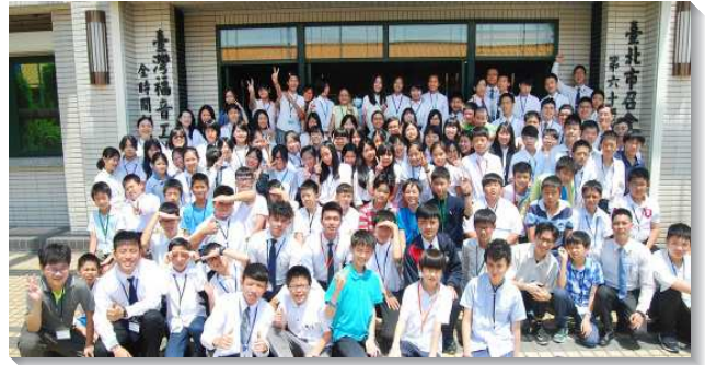
▲國一聖徒成全訓練

例如，在性格的操練上，服事者幫助他們學習認真規劃個人的時間表，操練把自己的衣物整理好，並將環境打掃乾淨。有學生見證自己原本沒有摺衣服的习惯，現在連襪子都願意好好的摺整齊。另外，學生為了在新的學期中能在校園為主傳揚福音，也寫下申言稿，願意操