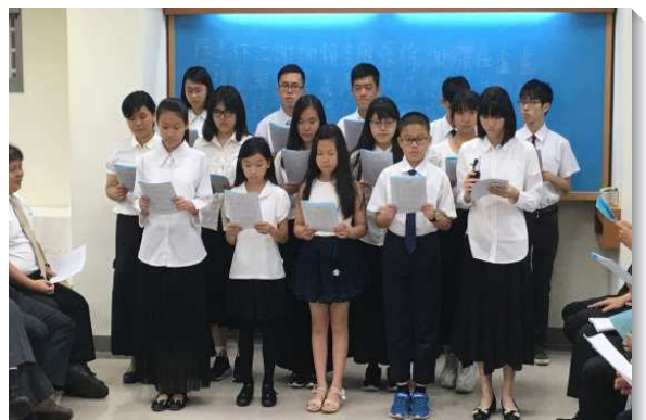
▲畢業生在畢業聚會中展覽

這場畢業生聚會將服事者和學生們對人的負擔，再如火挑旺起來，聖徒仍持續為畢業生禱告，服事者打開家愛筵學生，尋回幾位大學畢業的弟兄。一位國三畢業的姊妹更在參加高中一週成全訓練期間帶她的同學得救。服事者也做榜樣，帶領為他們購屋的朋友受浸。讚美主將果子加給我們，眾人都受了鼓舞，喜樂滿懷，願意忠信的將人帶到主面前來。（林麗娟）