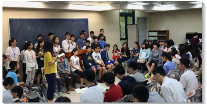
▲信松、港湖區高國中暑假特會

青少年於每堂分組時間讀聖經本文，認識真理、事實。信息傳講中將約瑟的特質、榜樣刻畫在青少年裏面，使他們看見異象且活在異象的管制下，把握黃金時期，積存糧食，成為召會的福源。在特會中他們也奉獻自己，有對付和清理。回到家中立即整理髒亂的桌面；父母有需要時，操練不埋怨、不講理由，學習像約瑟說：『我在這裏！』盼望各樣操練，能落實在青少年的生活裏。