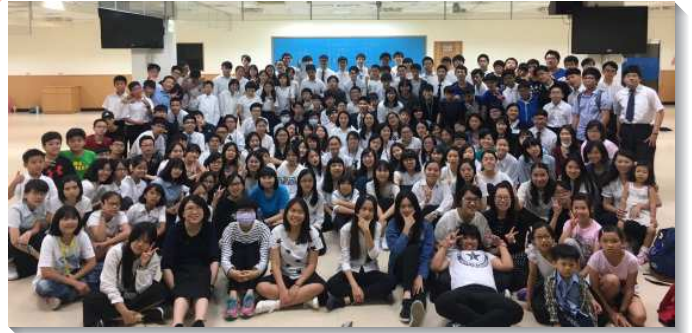
▲北投大區高國中暑假特會

文山二、三大區 ，於十三會所舉行。特會中的負擔在幫助青少年認識神的經綸並加強屬靈操練。期望青少年在特會中靈裏受感，願意將自己奉獻給神，日後操練規律的神人生活而能成為活而盡功用的肢體，領受神的託付。分組時間，青少年操練向主禱告，將自己奉獻給主。最後一堂聚會，許多青少年上台，在眾人面前宣告自己的奉獻心願。特會也交通到課業、親子、交友等專題，給青少年實際的幫助。此外也有傳福音的操練，青少年列出名單、為人代禱、邀約同學，有多面的蒙恩。