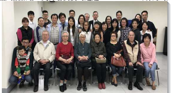
▲聖徒同心合意增排增區

願主祝福我們，叫我們一同經歷風、雲、火，帶進金銀合金並四活物的配搭，讓我們召會生活不斷往前，不僅人數加增，更得著真實的建造。（黃昊威）