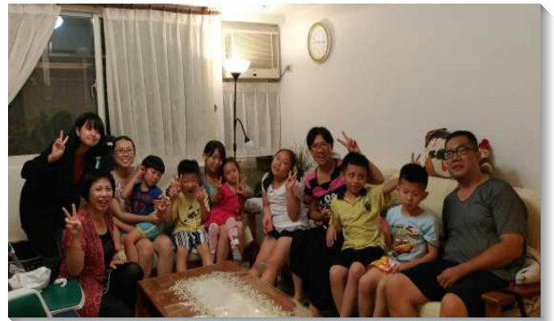
▲聖徒陪伴兒童，歡聚兒童排

目前這個兒童排每週固定有八位孩子參加，聖徒還積極邀約孩子的同學來參加，也邀請青少年來配搭服事兒童。召會生活真是甜美，願主祝福這個兒童排能恩典更洋溢，人數更加增。（鄭傳美玲）