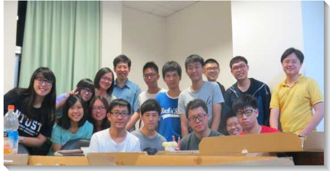
▲聖徒同心開家增區

弟兄姊妹對主相當認真且單純，大家同心領受增區的負擔。新人也一起操練出去傳福音，並堅定持續的邀約他們的朋友來參加主日或小排。小區裏的聖徒多為單身，租屋在外，另有許多住在弟兄姊妹之家的大專生，都不易把家打開，在尋求時，主題醒我們，福音朋友的家也可以打開。於是我們開始到福音朋友的家