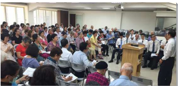
▲聖徒們參加成全聚會

成全聚會的負擔與內容是基於主恢復中的四大支柱，第一是真理，第二是生命，第三是召會，第四是