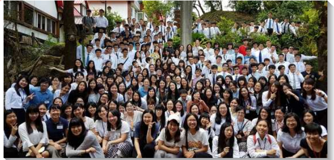
▲大學聖徒參加期末特會

二、見證與專題的激勵。此次特會的蒙恩亦在於見證與專題的安排，使在學聖徒從許多見證人身上看見愛主的榜樣。如在台北陽明山的聚集，有一對夫婦，分享讀經及追求主該有的態度。宜蘭的場次有弟兄交