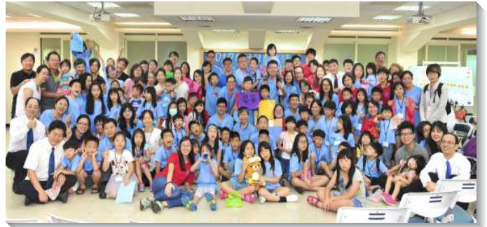
▲親子一同參加健康生活園

下午有精心設計的闖關活動，過程中需要與同伴彼此配搭，實際操練應用『恆忍』，並在愛裏彼此擔