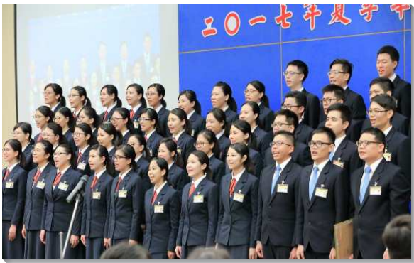
▲學員在畢業聚會中唱詩

聚會開始唱詩『進入幔內，就必出到營外』。這首詩歌說出基督徒一生的道路，因著不斷的進入幔內，認識基督這位聖中之聖者，因而丟棄地上迷惑人的事物，跟隨主的腳蹤，奔跑十架路程。接著學員們展覽畢業詩歌『同奔賽程』，描繪出學員們如何蒙主呼召，奔跑屬天賽程，因望斷於主，脫去重擔，並且經歷在身體中同跑，奉獻一生，要上去得獎賞！