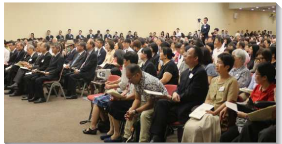
▲各地聖徒前來參加學員畢業聚會

最後，教師們用李常受弟兄於一九九五年給畢業學員的臨別贈言勉勵學員：『永遠不要忘記：三一神永遠的經綸是要產生並建造基督的身體，以終極完成新耶路撒冷，就是祂心頭的願望和終極的目標。神揀