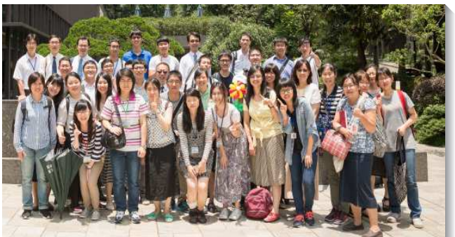
▲青職聖徒喜樂相調

這次青職聚會安排兩個班：『基礎造就班』，幫助新人呼求主名，操練靈並享受主。『繁殖擴增班』，邀請許多青職的家分享他們增排、增區、增會所的見證。因著他們在生活中彼此相愛、互相牧養並探訪聖徒，對人有真實的關切，就使人看出神真是在我們中間。這些見證激勵青職聖徒更多為同事及朋友禱告，並帶回到各大區的青職排裏，使我們在職場上為主得人、得地，為著建造神的居所。（王興睿、陳彥興）