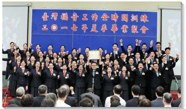
▲畢業學員喜樂領取畢業證書

見證的最後一段，說出在終極的局勢中，需要擔負終極的責任。學員們不只更認定這榮耀的賽程，心志上也