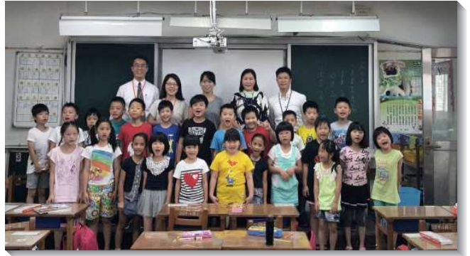
▲聖徒到校園教授生命教育課程

此外，聖徒多年為中山國小的福音禱告，今年三月起，主讓我們將得榮基金會的生命教育課程引進校