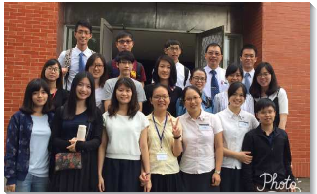
▲聖徒們一同參加期末特會

末特會前，服事者帶著青少年為特會禱告，讓他們自然而然的先進入特會的負擔。感謝主，這次特會果然不一樣，除了唱詩時彼此挑旺操練靈之外，聚會信息更滿了主話的供應，讓青少年們滿了享受。並且藉著豐富的相調行程，青少年彼此也更加敞開，突破同伴間相敬如賓的感覺，而且高中生對剛升上國一的小弟兄也有牧養的負擔，扶持鼓勵他們一同上台分享。