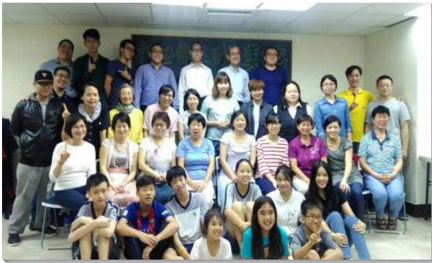
▲聖徒們同心配搭福音餐廳

聖徒不僅邀約同學親友前來，更在會前的整理備辦與會中的用餐交通及會後的收拾，實際的擺上服事。每次用餐後，以桌為單位，彼此認識並分享，接著有聖經短講或福音信息，再有陪談顧惜人，都使人因著