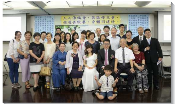
▲聖徒扶持新成立的家

我們一同經歷萬有都互相效力，叫愛神的人得益處。願主祝福祂的召會，有更多的家被興起來，侍立主前、堅固在召會中，成為祂榮耀的彰顯。（駱頌揚）