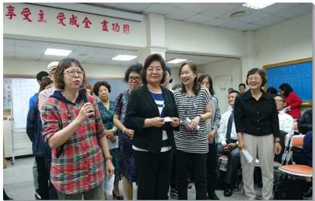
▲聖徒們歡喜宣告增區

盼望主再作新事，祝福召會能達到繁增的目標，並藉著強而有力的話語供應，產生更多的活力人，帶進更多的家、排，相調以及增區的實際。（周子敬）