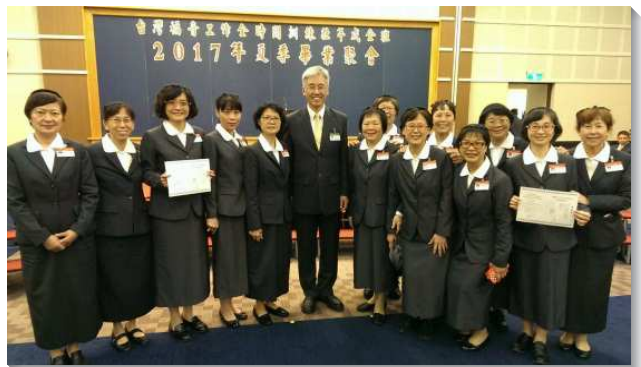
▲畢業學員喜樂領取畢業證書

改並轉向主，打開心房，除去帕子，終於走出陰霾，可以向主說：『主，我仍然愛你』。有人因為教師的話『肯學』而得了開啟，使她定下心來學習操練，忠信牧養聖徒交託的小羊。有人愛面子不敢傳福音，但藉著教師的說話，學習留在基督的死裏，配搭出外叩門傳福音，並在一週福音開展中喜樂的傳講人生的奧秘。遠自南美巴拉圭的一對夫婦同來參加訓練，經過一年訓練，弟兄學習不再過兩套生活，能憑著靈生活服事，姊妹則經歷同伴的扶持代禱，享受教師的真理傳輸，開了屬靈胃口，全人變化，被真理構成。