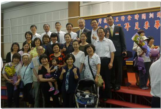
▲聖徒扶老攜幼前來參加學員畢業聚會

壯年成全班夏季畢業聚會，於六月二十三日上午九時三十分在中部相調中心舉行。二十二日下午，一些前來扶持的聖徒即提前到達，參加屬靈問答專題交通。二十三日一早，台島各地召會及海外聖徒即陸續湧入會場，給予學員鼓勵與祝福，與會聖徒超過一千人。本期畢業學員有弟兄三十一位，姊妹六十一位，共九十二人。經過一年的訓練，眾人一同見證，訓練如何變化了我們，使我們成為主合用的器皿。