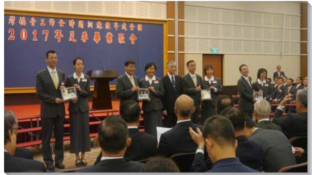
▲夫婦學員一同參訓，畢業獲獎

緊接著，另九位學員進行第二階段蒙恩見證。有人看見花東偏遠地區召會的見證與需要，畢業後願意受差遣，配搭花東地區的開展。有人生性木訥寡言，但參訓後，操練學習申言，為主說話，供應生命。有人在一週福音開展中經歷破碎與加強，在與同伴配搭中豫嘗新婦軍隊。有人藉著閱讀書報與讀經，享受主的話是靈是生命，脫落了原本轄制她的手機遊戲與電視。有人在深處有個傷痛一直未能過去，但在午禱時蒙主光照，流淚悔