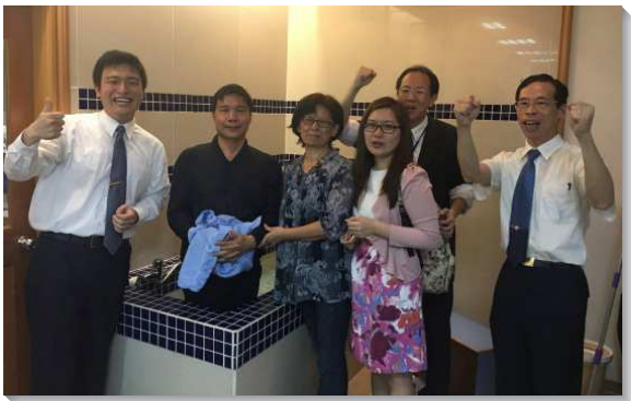
▲主日福音聚會後新人得救

潔每個角落，大家用心佈置會場、擦拭椅子、擺設鮮花和盆景，使會所煥然一新。主日上午九時，青少年們就在門廳彈吉他唱詩迎賓，喜樂洋溢，使來賓如沐春風。擘餅聚會後，青少年們先展覽詩歌作為福音見證聚會的開場，一首接一首的詩歌，使人的心柔軟。接著一個個感人的見證，令人靈裏感動，加上剛強的話語和美好的呼召，使福音朋友魂裏甦醒，靈被點活轉向主。