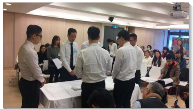
▲成全訓練中的主日擘餅

第一堂交通餅杯的意義、分組操練擘餅讚美主，讓新人對主日聚集有充分的享受與參與，個個起來開口禱告讚美主，雖不老練卻靈裏新鮮。更藉由一個個的呼求主名操練靈、一句句的禱讀主話，並在各小區得幫助，建立晨興的生活，開啟對主話的胃口。會所青職也特別為新人們錄製福音詩歌光碟，讓每位新人能