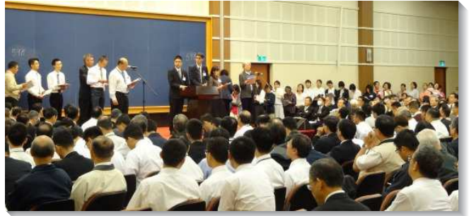
▲聚會中聖徒們踴躍上台分享

第三篇說到我們一切的事奉必須是由神發起。若是我們的服事不是神來發起，我們就會有干犯聖所的罪。第四篇給我們看見召會的性質是神聖的，基督的，復活的，屬天的。因此，在召會生活中，我們就需要藉著神人調和，儆醒保守召會的性質。第五篇，當我們看見了