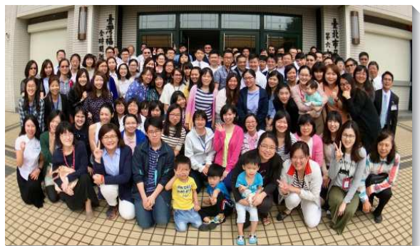
▲青職聖徒參加成全聚會

願主繼續加強青職聖徒藉異象的開啟、榜樣的激勵，起而願受成全、實行神命之路，過豪邁喜樂、合乎神心意的召會生活，成為轉移時代的一班人，更有實行的恩典往前，直到把主帶回來。（陳立文、陳深泓）