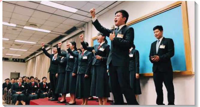
▲學員們分享開展蒙恩

在團體一面，學員們見證這次的開展，不是學員的開展，乃是身體的開展。因著每一隊的學員人數不多，甚至四人就組成一個開展隊，故學員出發前，就迫切為著各地聖徒能積極配搭禱告。學員分享，每到傍晚集合豫備外出時，聖徒來到會所，就說，『有你們學員來配搭，加強我們的開展，我們好喜樂』。但學員的心裏卻想著：『我們才需要聖徒的配搭，看到你們，我們的疲憊都消失了！』因著許多聖徒如同雲彩