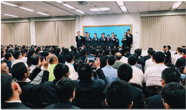
▲受訓學員鄉鎮開展見證聚會

學員們見證在各地開展的蒙恩，分為兩面。個人一面，學員藉著每天各三十分鐘的個人晨興、午禱，與主有親密的交通，得著主話的供應與加強，勝過了環境不適應、配搭不協調等問題，走出自己的天然限制。亦有學員分享，起初只在意開展目標，當時卻一無所獲，被