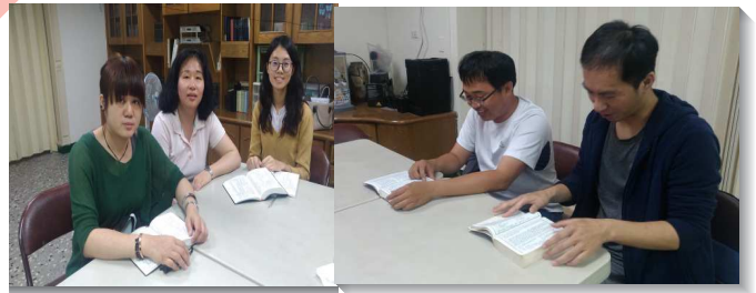
▲聖徒實行家聚會牧養

另一面是陪個人家聚會的蒙恩：去年我們得著一些新人，負責弟兄鼓勵我們要實行家聚會牧養人，有位弟兄是廚師，工作非常忙碌，但他領受負擔，牧養一位剛得救的弟兄，藉由週週讀生命課程，一週一課的餵養，使初信的弟兄喜樂的享受召會生活。在已過四月的福音聚會中，這位初信的弟兄雖然生性害羞，卻能剛強的在眾人面前作他得救的見證。去年年中，有位弟兄一家三口從內地遷至東湖，廚師弟兄與他的姊妹就一同在每週五的小排會後，以生命課程來餵養這個家，許多次的家聚會都至凌晨十二點才結束，因為這個家非常享受生命課程的內容，姊妹因而對聖經這書中之書有更進一步的認