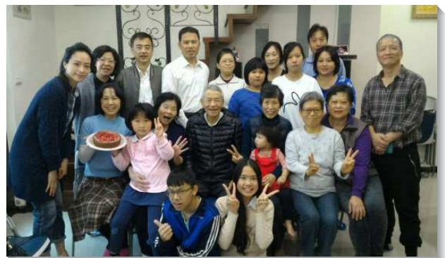
▲聖徒齊心努力增出新區

在豫備增區的過程中，聖徒經歷一次次的環境，使我們學習憑信往前。有位姊妹在癌症術後，發現仍有癌細胞存留，藉著身體的扶持與代禱，面對艱難的第