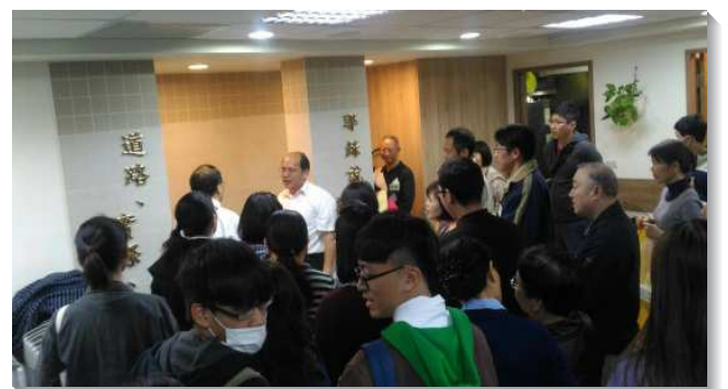
▲聖徒為新人受浸禱告

弟兄總結，信主使我們罪得赦免、有永不改變的愛、有甜美的召會生活、有榮耀的盼望。藉著這些豐富的交通，相信生命的種子，已撒在福音朋友的心裏，我們仍要持續積極傳揚福音。求主聽我們的禱告，繼續將平安之子賜給祂的召會，加增人數，多如羊群。（許聖倫）