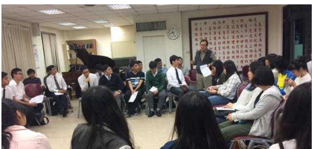
▲新中區大學學生聚會

新 中區有八所大專院校的大學生，本學期固定於週六晚上七點在一會所二樓一同聚集，追求書報『包羅萬有的基督』。每次聚集約有四、五十人，聚會前，學生中幹有半小時的守望禱告，為眾人能夠在聚會中被主充滿，也為弟兄姊妹們的申言能剛強釋放代求。聚會開始，先唱詩歌、挑旺靈；再由一組學生鳥瞰書報的內容，最後還有弟兄們加強負擔的話，把眾人一同帶到基督包羅萬有的豐富裏。