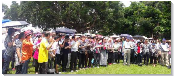
▲長青聖徒戶外相調

還有位弟兄交通，生命就是神的內容，建造是為著神團體的彰顯，實行的路就是牧養。藉著增排、增區，堅