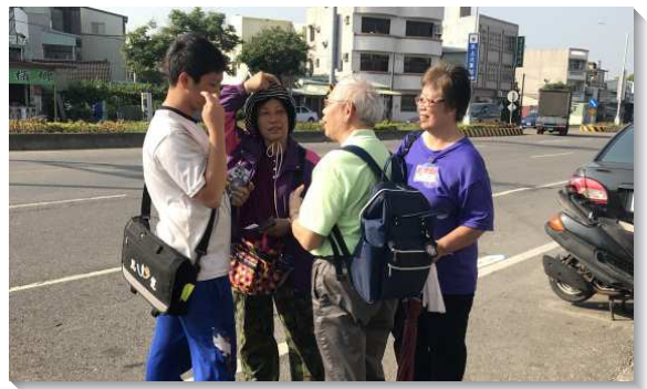
▲學員向青年人傳福音

在臺北一個較傳統的社區裏，學員們豫備在主日擘餅後舉行福音聚會。當天一早，學員利用喫早餐的時間接觸人，當他們發單張給等候點餐的客人時，一位年輕人主動表示想要得到聖經，用餐後，學員們帶他到會所，向他介紹新約聖經恢復本，立即帶他受浸得救。同一時間，還有另一位買早餐的女學生也聽了福音而受浸。