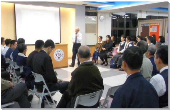
▲學員與聖徒配搭福音聚會

全體學員於第二梯次全台弟兄集調結束後，即前往各開展地。眾人士氣高昂，開展第一天就旗開得勝，新北市淡水區、桃園、新竹、苗栗、台北二十會所、二十二會所等隊，率先結了九個果子，各隊同得激勵，儆醒禱告。往後數天，各開展隊奮力爭戰，時時傳來捷報。