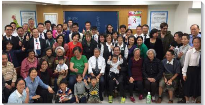
▲聖徒們同心合意開展新區

我們在叩門時邀請一位女士來參加福音聚會，她唱詩就開始流淚，也願意受浸。但在浸池前卻退縮跑回