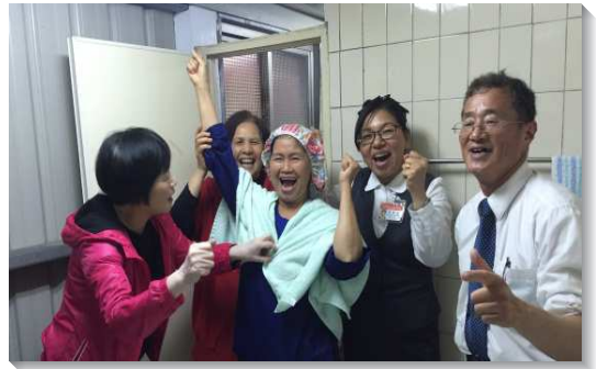
▲在台北二十會所，新人喜樂得救

在東部，學員陪伴一位已得救多年弟兄的母親，一再的唱台語詩歌，她受感流淚，願意接受主。當六十二歲的兒子為八十五歲的母親施浸時，眾人都淌下感動的熱