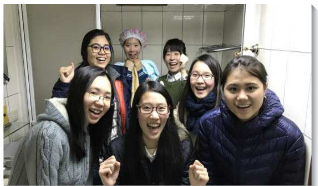
▲新人得救，聖徒一同歡樂

主也帶領我們堅定持續的操練傳福音，在三月底與四月底的全會所福音聚會中，有近三十位福音朋友參加，四位福音朋友當場受浸。至四月底全會所已受浸十五人。神的話擴長起來，門徒的數目就大為繁增！我們願意緊緊跟隨帶領，出代價買真理，被神的話構成，以其作我們福音的內容，將人引進召會生活，讓主在我們中間有通達的道路。（張永基）