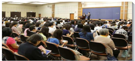
▲國殤節特會暨禱研背講聚會

第四篇說到基督的擴增，為著召會的擴增與開展乃是藉著同心合意，為此就需要顧到同一件事：就是神永遠的經綸，以基督為中心及普及。實行同心合意的