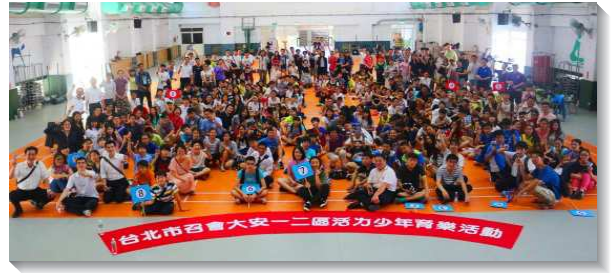
▲大安一二區活力少年育樂活動

共組成了十七個小隊，在輕快的詩歌過後，就有挑戰的體驗活動，每一關都考驗團隊合作、默契，以及青少年們思考的領域。也藉由服事者們在各項活動中引導他們進一步反思活動的意義，並實際聯於青少年的生活態度、應變能力等，有趣又有意義。