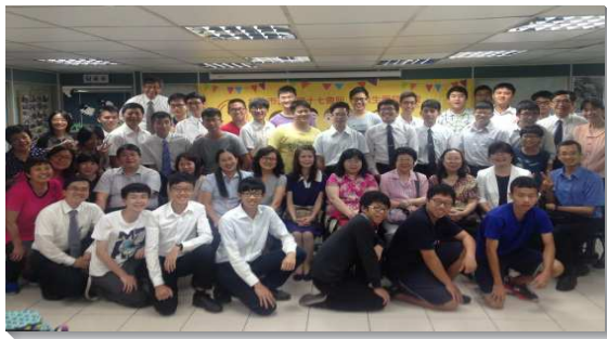
▲建中畢業生愛筵聚會

六月五日的晚上在會所有建中畢業生愛筵聚會，聖徒和家長們同來見證神在這群孩子身上的製作。一開始先享受豐富的愛筵，社區聖徒們帶來豐富美味的料