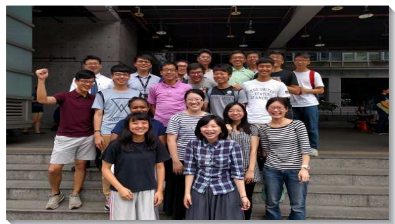
▲教職員聖徒配搭校園排

學生聖徒們藉此聚集在校園中享受主，校園生活和召會生活不再是分開的，也興起對同學的負擔，邀約福音朋友一起來認識主，更製作邀請卡、海報，利用社群網站廣邀同學，配搭同盡功用。開學至今每次聚集平均約十五至二十人，每次皆有二至五位福音朋友和新人參加。這樣的蒙恩不僅在學生身上，校園裏的教職聖徒也一起來扶持學生們，彼此挑旺福音的靈，