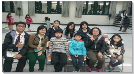
▲聖徒積極接觸人，兒童得增加

再來是在週末時，社區中有許多孩子都由家長帶到校園運動，我們就藉此機會接觸他們。在孩子們玩樂時，聖徒就自然的和家長聊起家中小孩的情況，漸漸增加了熟悉度，幾次之後就邀請他們來參加兒童排。有兩位家長因為他們的孩子和召會中的兒童是同學，彼此都熟悉，就放心讓他們的孩子來到召會中，這兩個男孩都是家中獨子，平日在家沒有玩伴，歡然加入兒童排，與其他小朋友成為同伴，其中一位在主日也常來聚會。