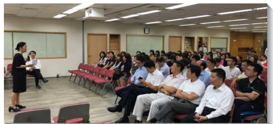
▲青少年家長座談聚會

接著播放影片為家長們介紹青少年服事現況。服事者們每個月為著青少年的聚會、活動，有充分的研討和事奉交通；甚至也規劃數次服事者的外出事奉相