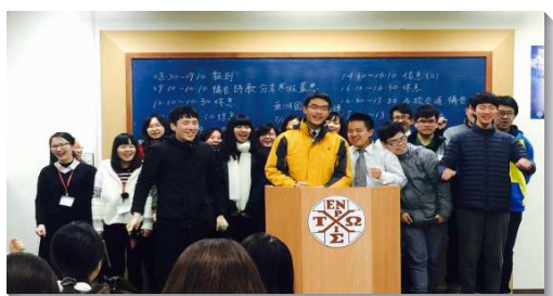
▲士林區大學聖徒期初特會

士 林區大學服事者與大學聖徒藉著多而徹底的禱告與交通，一同尋求上半年的負擔及目標。眾人在主面前立大志設大謀，要以傳福音得新人，並興起讀