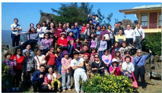
▲聖徒外出喜樂相調

自改屬文山二大區後，十會所聖徒藉著禱告與主同工，得著新的復興，落實初信成全、健全排組架