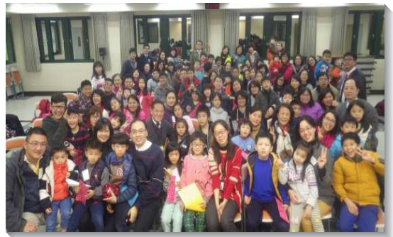
▲神人生活家庭，親子同受成全