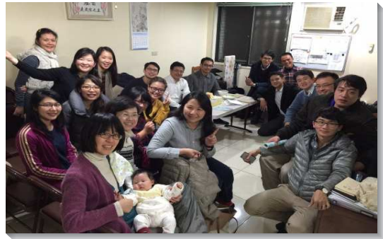
▲聖徒排中相聚，歡樂溫馨

弟兄們鼓勵聖徒裝備主的話，被真理構成，各大區建立晨興追求，更鼓勵人人線上晨興。並有每週四的週中成全訓練，每月一次的在職成全訓練，和出埃及