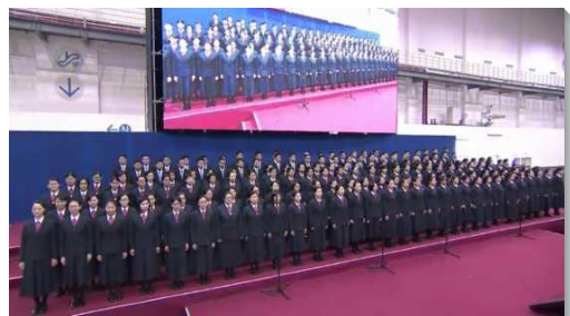
▲ 全時間訓練學員展覽