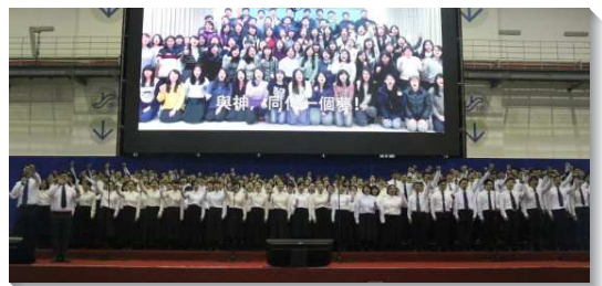
▲ 大學聖徒展覽詩歌

接著，更向全場福音朋友推廣這榮耀的福音。有十二位弟兄姊妹見證自己信主後生命的改變。一位大學畢業的姊妹，在校期間任班代、進校隊、忙社團。畢業後頓失方向，一年內換了十個工作，只能靠大量運動與大量的吃排解鬱悶，卻仍是空虛無助。直到得救後，就不再被網綁，有主作她的真滿足。另一位在地檢署工作的姊妹，因工作之故，造就她高傲的性格，得救後服事青少年，總是嚴格的對待青少年，後來被主變化，能用神的愛來服事人，發現他們長進的很快，現在也可以服事人，見證主真是她的救恩。藉著豐富寶貴的見證及福音短講，使在場未信主的親友們得以認識福音的真諦，有機會接受救恩。