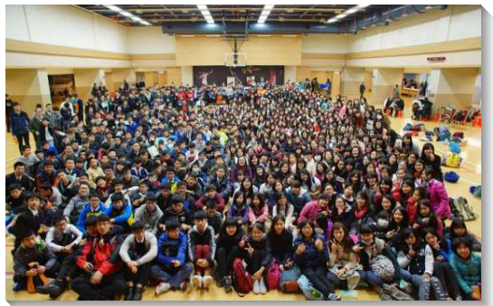
▲中學生參加特會，一同往前

高中生特會主題為『召會—基督的身體（下）』，啟示『召會在七個時期的進展』，以及『主恢復的三個方面—神的啟示、神人的生活、召會的實行』。信息中，弟兄勉勵學生們，求學生涯裏需要對主有許多