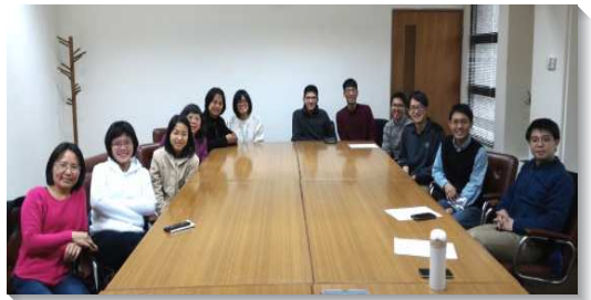
▲聖徒們中午一同用餐、追求

我們每天早晨在一位姊妹的實驗室裏一同晨興、用早餐；每週四中午則在一位弟兄的研究室裏小排聚集。藉著生活中緊密的聯結以及主話的供應，福音朋友們日漸渴慕救恩，願意受浸，與我們同過甜美的身體生活。