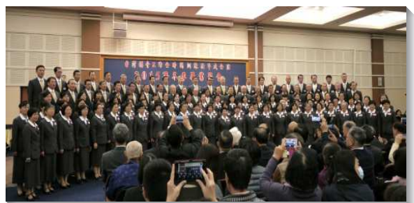
▲畢業學員展覽詩歌