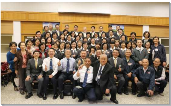
▲學員與各地聖徒相調

讚美主，藉著多方代禱、同心配搭，以及三一神大能的輸供，每一場展覽聚會都是恩典的展示，見證我們是神的傑作。學員們的見證，激勵聖徒抓住機會，投身訓練。主的恢復要藉著一班受過訓練的聖徒往全地去而擴展。我們甘願奉獻自己，使主恢復的前途如日頭出現，光輝烈烈！ （陳美秀）