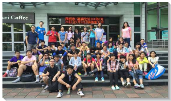
▲青少年邀約同學朋友參加相調

經過三個月的預備，我們於十月底舉辦一次相調行動和福音聚會。當天下午，青少年們搭車至萬華運動中心，藉著團體活動彼此熟悉，讓朋友們心敞開。接著，我們一同回到會所參加福音聚會。會中，青少年弟兄姊妹們操練領詩、作見證、傳講信息並呼召受浸，靈裏活潑且剛強。此次共有五十五位青少年參加相調和聚會，包括