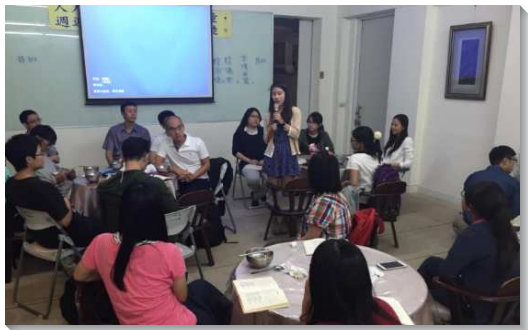
▲陽明大學福音座談

一對夫婦打開家為著福音的開展，退休後仍持續關心從前的同事。他們花超過一年的時間接觸這些福音朋友，