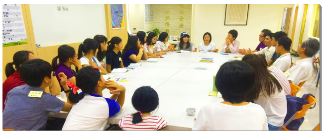
▲ 聖徒與學生配搭，邀請同學到會所聽福音

今年下半年，大學專項服事者們持續響應『全台新人得一萬』的負擔，推動福音與牧養。九月福音節期的熱火持續焚燒，至十一月已得著了將近三百位大學生，至今仍穩定得人。我們蒙恩的關鍵，就是『同心合意』與『堅定持續』。各校園、各會所中，弟兄姊妹們都同心合意，堅定持續的禱告和出外叩訪，主就將