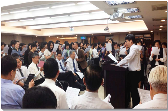
▲北投區各會所共同舉辦成全訓練

十月底至十一月初，北投大區各會所共同舉辦基督傳家成全訓練，有五百多位聖徒及福音朋友參加。此次訓練的負擔強調『家』在神經綸中的重要。我們若盼望兒女被主得著，家中充滿屬靈的空氣，自己就