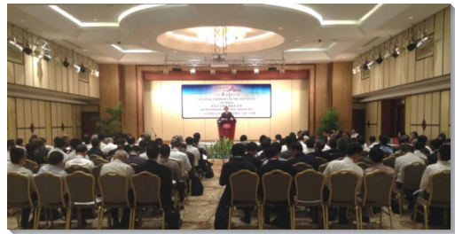
▲『主在亞洲的行動』交通於柬埔寨舉行

需要在事奉上年年有進步。為此，我們需要作統計，特別是關於神命定之路的操練與實行的統計。統計會說出服事上真實的情形，使我們得以往前。其次，我們亟需建立神命定之路的架構。主僕李常受弟兄會給我們一個照著聖經所啓示，神所命定生機建造基督身體的模型，要我們忠信的按圖施工，建立神命定之路的模型。我們若在各地建立神命定之路的模型，為此背負責任，當我們見主時，就不會羞愧。這將滿足神的心意。