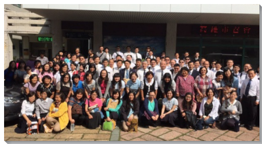
▲全台兒童服事者代表齊聚高雄新盛會所

願我們都有神經綸的眼光，有主耶穌憐憫人的心腸，有保羅流淚禱告勸誡的靈，在公眾面前，並挨家挨戶服事人，帶進更多兒童和家長。（張武旺）