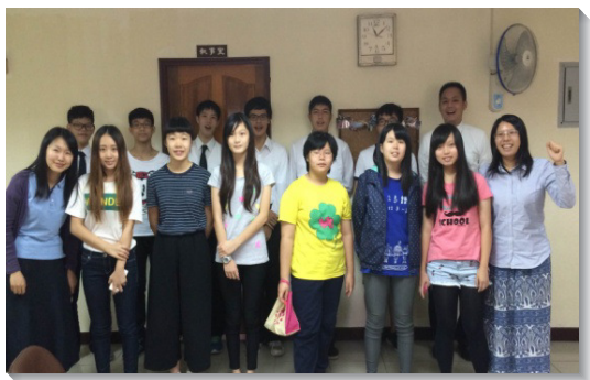
▲青少年區學生們與服事者合影

九、四十六會所目前約有三十位青少年弟兄姊妹和福音朋友，多年來都在青少年區裏同過召會生活，接受餵養。本學期開始，服事者們響應『全體事奉』的負擔，鼓勵青少年主動在主日和小排聚會中盡功用，