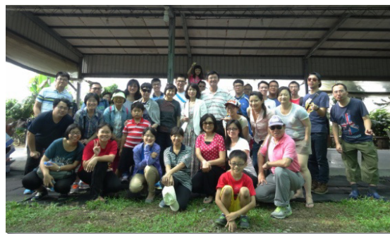
▲青職聖徒出外相調

除此之外，我們也藉著一年兩次出外相調，使青職聖徒彼此交通更為親密、透徹。已過國慶連假期間，我們前往台中訪問太平區的聖徒。我們在會中一同進入信息，分享見證，領受關於福音、真理、召會、事奉的異