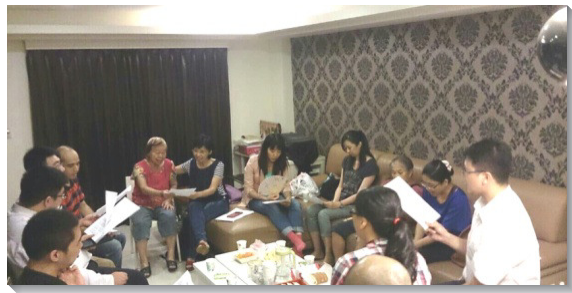
▲ 聖徒喜樂的小排聚集

有一個區的弟兄姊妹們，從五月起分成兩個小排，每週在家中聚集，彼此關心，各盡功用。有些聖徒在聚集中主動選詩歌或教唱詩歌，使眾人在靈中與主相交。有些聖徒則規畫相調行動，將眾人相調為一。更多時候，我們生機的編組出外訪人，到初信者家中聚會，邀約福音朋友愛筵或參加相調行動。我們也鼓勵福音