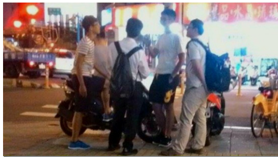
▲ 聖徒與學生配搭出外傳福音

同時，我們也操練實行家聚會，將聚會帶到人的家中，使人被真理構成。目前約有六十三位聖徒有分家聚會。在家聚會中，初信者得著餵養，聖徒也得著造就。有些久未聚會的聖徒恢復晨興生活，新人也穩固在召會生活中，甚至配搭傳揚福音。有一位剛得救的姊妹，因著在家聚會中倍得供應，積極與丈夫分享主話，使丈夫深受吸引，不久後也信主得救了。這位弟兄也在家聚會中主動分享，鼓勵另一位福音朋友尋求主，這位朋友也欣然受浸得救。主的作為實在奇妙。我們願積極與主同工，得人並牧養人。（楊承錡）