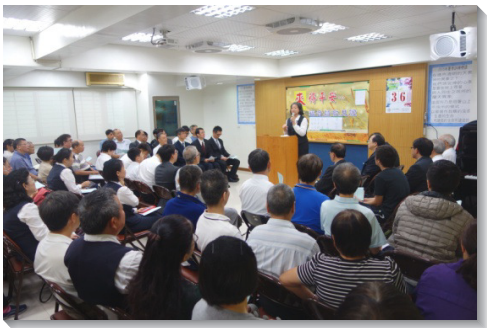
▲學員向眾人分享福音見證

我們經歷福音的傳揚乃是一場屬靈的爭戰，有些地方偶像林立，有些地方人心封閉。但各隊學員們藉著多而又多的禱告，擊敗仇敵。各地聖徒與學員們彼此扶持、代禱，同心合意的配搭，眾人如同一人，作基督團體的戰士。我們彼此鼓勵，要同靈，同魂，同禱告，還要同工，同勞，同建造。每當一地傳來捷報時，各隊就同聲歡呼；若看見同伴陷入為難時，眾人就立即代禱。