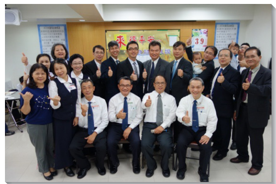
▲學員們與配搭聖徒合影

我們雖是軟弱，但主使我們稍微有一點能力，來遵守祂的話。我們和各地聖徒緊密配搭，如同『兩營軍兵』，順從元首基督。主使我們看見，惟有同心合意，彼此順服，才得以經歷基督的得勝，福音才有出路。我們操練不住聯於主，倚靠祂的憐憫和恩典，經歷祂復活的大能。主也將得救的人，與我們加在一起。有位全身刺青的年輕人，主動前來表示『我需要主』。我們曾在廟口遇到四位年輕人，聽完福音短講後，簡