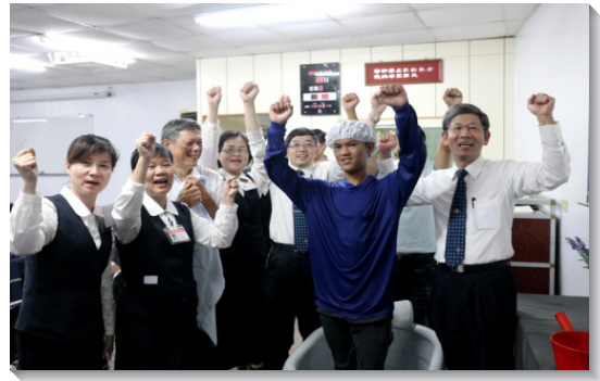
▲眾人一同歡喜領人歸主

傳福音的過程中，我們操練不憑自己的意思揀選人，不住的禱告，求主將平安之子分別出來，讓我們遇見他們。我們的腳蹤遍及街頭、賣場、醫院、校園、車站，無論在清晨、正午、傍晚、夜間、用餐或購物時，都運用智慧，把握機會接觸人，傳講神國的福音。