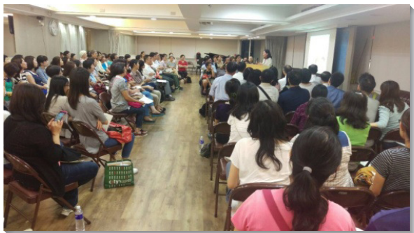
▲兒童家長們熱烈參與座談

我們盼望兒童家長座談成為傳福音的憑藉，不僅向聖徒傳輸負擔，更能藉此接觸到眾多福音朋友的家。兒童實在是個大的福音，能夠帶進一個又一個家，進入召會生活。 （李正偉）