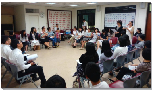
▲兒童服事者們分享、交通

首日聚會一開頭弟兄便交通到兒童服事應包括的三個部分：神人生活、兒童排和兒童聚會。平日在家庭中，父母就應當以身教養育兒女，過神人生活。兒童排是要幫助孩子們彼此聯繫，到了主日則有兒童聚會。對於主日兒童聚會，家長及服事者都應各自負起不同的責任，家長要幫助孩子預備好，準時並專心與會，還要題醒孩子彼此邀約，將同伴帶來聚會，會後也應主動了解孩子在聚會中的狀況，與服事者配合。服事者們事前要有充足的預備，與配搭聖徒聯絡協調，培養默契，活動的設計必須能夠吸引孩子，並為孩子們