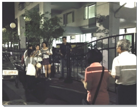
▲聖徒們配搭到宿舍附近接觸學生

同時，為配合福音與牧養行動，我們也更落實召會生活人數的統計，詳實填寫聖徒資料，為要牧養每一位聖徒。弟兄姊妹們竭力操練送會到家，主動探望未能與會的聖徒，將他們掛在心上。願主記念並保守我們的實行，能忠信的堅定持續。 (胡辰榜)