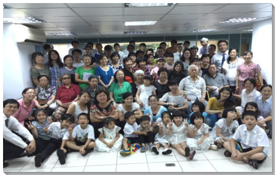
▲七月五日集中主日會後合影

哈巴谷書三章二節說，『耶和華啊，求你在這些年間復興你的工作。』在神的選民中間，一直有復興的渴望。四十七會所成立三年以來，弟兄姊妹們深處都響應神心頭的願望，建造召會，成為神在地上的居所。眾人同心禱告祈求、奉獻財物、傳揚福音、開家牧養，盼望為著主在這地的見證，帶進復興。