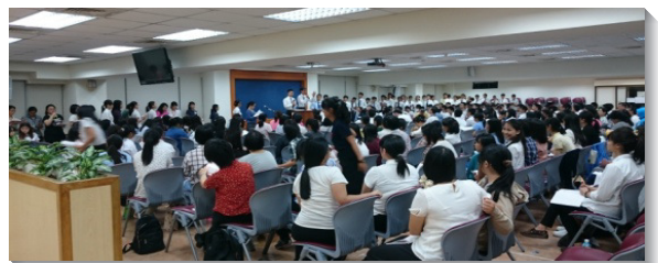
▲學生們上台展覽，眾人一同扶持

每篇信息後，弟兄都帶領我們團體或個人禱告，消化我們所聽見的負擔。藉著禱告，使這些話對我們成爲活的啓示，發出亮光，供應生命。聚集結束時，眾人分組禱告，一同奉獻暑期的時間，有分各樣屬靈的行動，爲著召會的建造。 (李海琳)