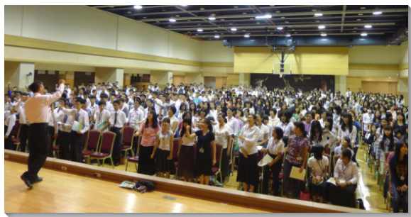
▲青少年弟兄姊妹在會中唱詩

國中組共有六堂課程，啓示獨一真神的名及其所是。服事者逐一陳明關於三一神、神的經綸、神的分賜、基督的聖稱和基督的身位的真理。這些信息要幫助青