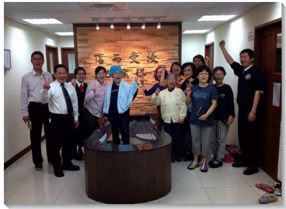
▲藉著叩訪，弟兄姊妹們喜樂領人歸主