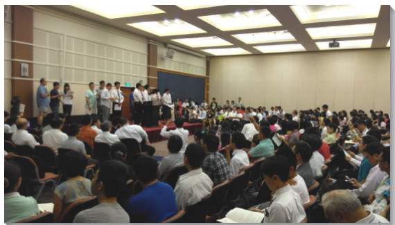
▲初信者踴躍上台分享

五月十六至十七日，第十九梯次全台初信成全聚會於中部相調中心舉行，共約七百位聖徒與會，還有兩位福音朋友在聚會期間受浸得救。此次與會的照顧者當中，許多也是第一次參加全台初信成全，他們