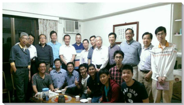
▲弟兄們在家中聚集、交通

在『家』的這一面，弟兄幫助我們看見藉家聚會牧養聖徒的重要，鼓勵我們送會到初信者或久不聚會聖徒的家中。聖徒們列出看望名單，在禱告聚會中提名代禱，並以訊息、電話持續關切，進而送會到弟兄姊妹家中。一位弟兄在受傷休養期間，因著聖徒堅定持續的探望，建立家中聚會，經過兩個月後，他對主話滿有享受，也回到召會生活。另有一位弟兄見證，因著聖徒鏗而不捨，週週到家中牧養，使他不僅恢復召會生活，也願配搭專項服事。讚美主，人人盡生機的功用，召會就得興旺。 （柴明德）