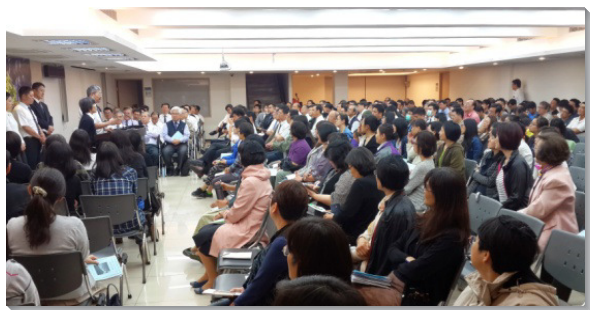
▲聖徒參加成全訓練，領受負擔

感謝主，藉著小排，更多聖徒得以盡生機功用，被培育、受成全。如此建立起普遍的祭司體系，人人都事奉，召會繁增且得著建造。 （謝李光瑩）