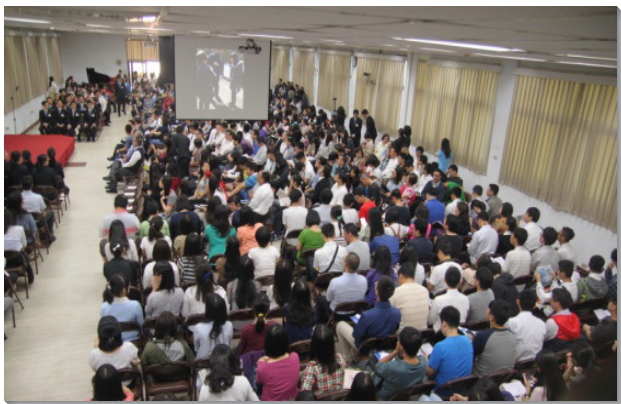
▲在台北場，聖徒觀賞訓練簡介短片

最後，眾人一同唱詩第三五五首：『起來！將這交易算看：零碎換來整個一萬事、萬物、加上萬人，竟都歸你得著。』在豪邁的詩歌聲中，許多青年聖徒上台報號參訓。他們蜂擁上前，宣告奉獻。與會的父老、服事者和同伴們，也全力扶持，一同歡樂。