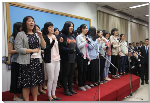
▲青年弟兄姊妹分批上台宣告奉獻

教師也說了一段加強的話，開啓與會的青年人，每一個蒙神拯救的人，都該作祭司來事奉神。正如路加福音一章七十四至七十五節所說，『叫我們既從仇敵手中被救出來，就可以一生一世在祂面前，坦然無懼的用聖和義事奉祂。』然而，事奉神是何其慎重，我們必須完全照著神的心意。舊約民數記給我們看見，作祭司事奉神的人，年齡必須是三十歲到五十歲，就是生命成熟，而沒有衰老的光景。祭司要照著神心意事奉神，與殿有關的一切事，都要照神的吩咐。為此，利未人在二十五歲就要進殿裏學習，三十歲纔能盡職。神安排五年的時間，叫祭司、利未人受訓練，使他們能合格的事奉。同樣的，今天在召會生活中，我們若羨慕事奉神，就需要擺出兩年時間，接受全時間訓練，作合格的事奉者，為著神的建造。