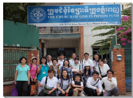
▲與金邊召會聖徒合影

我們首先抵達吳哥窟，訪問成立不久的暹粒召會。弟兄姊妹的靈剛強且活潑，一開口禱告，眾人都被挑旺，一個一個站起來為主說話。我們聽見許多寶貴的見證，例如當地負責弟兄，帶著六個孩子，答應主的呼召，前來此地開展，在重重為難中堅定站住。一位得救僅三年的本地弟兄，已完成全時間訓練，目前全時間服事，他積極學習中文，擔任我們的翻譯。還有一群二十多歲的青年聖徒，出代價參加訓練，願意為主權益而活，他們都回應主的呼召，宣告：『主阿！若不是我們起來事奉你，還有誰』。讓我們看見一班傾倒香膏的人，清心愛主毫不保留，深深的激勵我們。