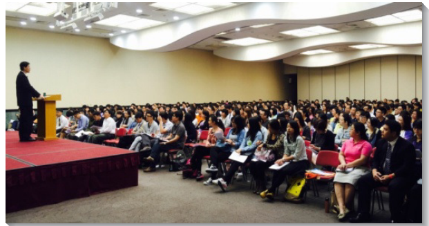
▲青職聖徒專注進入信息

盼望經過此次聚會，更多青職聖徒從世界的婚姻觀中蒙拯救，看見神聖經綸的異象。使我們的家成為絕對事奉神的單位，成為召會見證的據點。（汪長威）