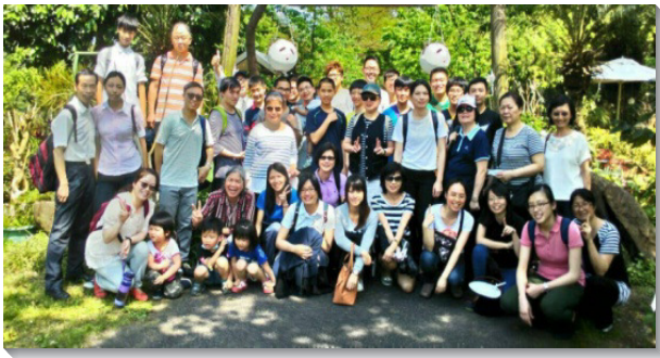
▲聖徒至平溪相調合影

已過清明連假，二十七會所弟兄們鼓勵各區規畫出外相調，與弟兄姊妹同過屬天節期，更藉此邀約福音朋友、初信者和久未聚會的聖徒有分召會生活。五個區總共九十位聖徒，分別前往十二會所、平溪和雙溪，其中有八位福音朋友和新人，以及三位久未聚會的聖徒同行。