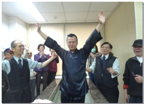
▲聖徒忠信出外叩訪，喜樂領人歸主

關於牧養的方面，由於得救的新人逐年增加，亟需合式的照顧。從去年八月開始，弟兄們看重家聚會的實行，盼望聖徒建立送會到家的習慣，能穀把召會作到家