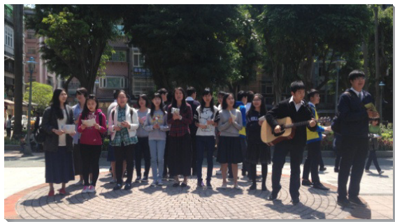
▲青少年至公園唱詩歌、接觸人

弟兄開啓我們看見作祭司的意義，就是人接受神，被神充滿、浸潤並滲透，甚至讓神從裏面湧流出來，以至成為神活的表現。我們不僅是聖別的祭司體系，代表人到神面前去，也是君尊的祭司體系，代表神到人那裏去。