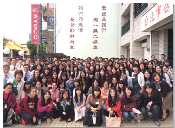
▲全北市大學畢業聖徒與服事者合影