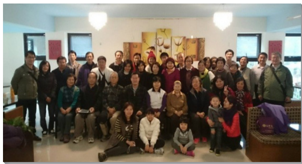
▲聖徒們彼此聯結，相調密切

繁增出新會所之後，需要更多弟兄姊妹投入各專項的服事，特別為著照顧青年人，培育召會的下一代。