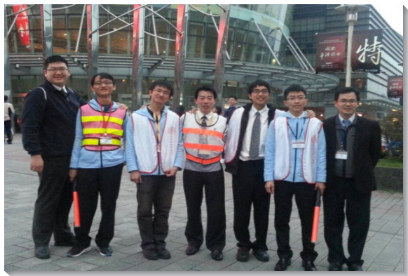
▲配搭交通管制服事的聖徒們

本次大會交通管制服事，全北市召會共計一百六十四位聖徒配搭一起，經歷復活的神在我們中間焚燒，使我們靈裏火熱，服事得喜樂並屬靈。