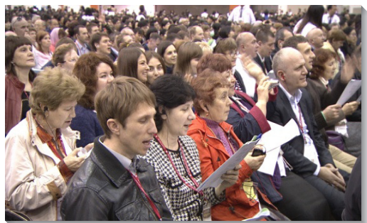
▲海外聖徒一同進入信息

同上前擘餅時，眾聖徒的讚美頌揚也達於頂點。場中，聖徒們以數十種語言，同聲宣揚阿利路亞，讚美之聲高昂不絕，甚至有許多聖徒感動落淚。雖然我們來自各國，語言文化各異，卻在同一的神聖生命裏，單單高舉基督，見證歌羅西書三章十一節所說：『在此並沒有希利尼人和猶太人、受割禮的和未受割禮的、化外人、西古提人、為奴的、自主的，惟有基督是一切，又在一切之內。』在這新人裏，我們願作今日團體的得勝者，迎接主來。 (董牧群、巫思賢)