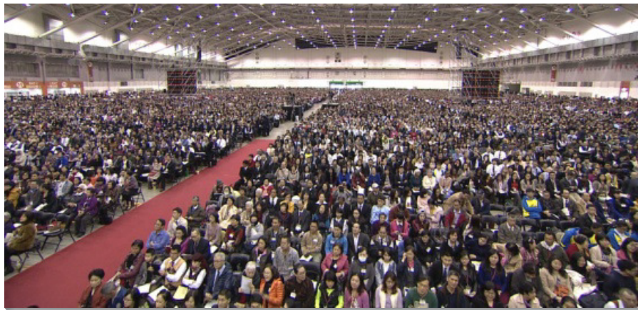
▲二〇一五年國際華語特會於台北南港展覽館舉行

第二天中場時間，全場超過三萬位海內外聖徒，共同有分主的桌子，擘餅記念主。當各國代表一