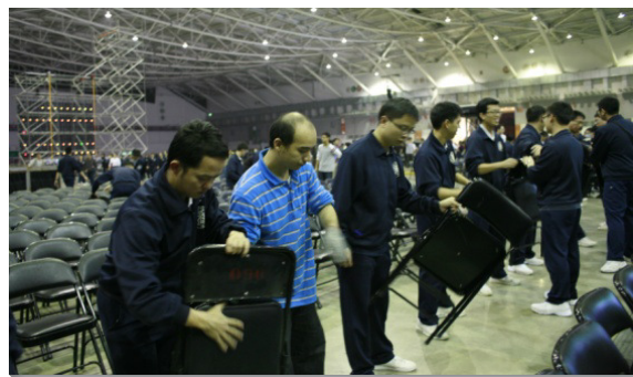
▲聖徒於會前擺放座椅