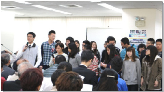
▲青少年聖徒在會中展覽，分享見證

今年的第一個主日，十六會所全體聖徒在信基大樓集中聚會，一同擘餅記念主。弟兄帶領我們進入出埃及記結晶讀經的負擔，陳明神的心意不僅是要我們經歷出埃及、過紅海，更要藉著享受基督作我們包羅萬有的美地，使我們無論男女老少，都能成為事奉