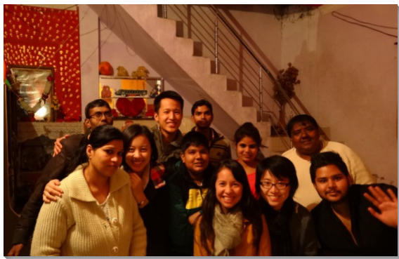
▲在賈朗達爾，福音朋友全家得救

本次開展，學員們前往台島六處地區：台北市召會五會所與網路資訊中心、台中市第五和第七期重劃區、雲林縣麥寮鄉、台南市永康區鹽行地區、高雄市仁武區、花蓮市火車站附近地區配搭；以及海外之印度賈朗達爾（Jalandhar）、法里達巴德（Faridabad）、塔那（Thane）、卡努爾（Kurnool）、蒂魯內爾維利（Tirunelveli）等五處城市。學員們與當地聖徒一同禱告，配搭開展，經