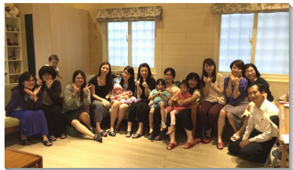
▲福音朋友在聖徒家中受浸後合影

這段期間有五位全時間訓練學員與我們配搭開展。學員們邀約社區聖徒一同外出訪人，享受傳福音、湧流生命的喜樂，而願意持續投身其中。聖徒們遇見敞開的對象後，便領受負擔回訪，邀約家聚會，與學員配搭餵養福音朋友。一位大學女同學，經過姊妹們一個月堅定持續的接觸後，便受浸得救。得救後，姊妹們