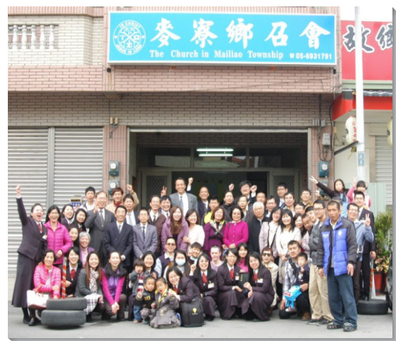
▲麥寮鄉召會成立，首次擘餅聚會後合影