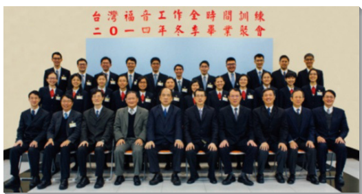
▲畢業學員與教師及輔訓合影

一〇一四年冬季全時間訓練畢業聚會，於十二月二十日上午在忠義會所舉行。本期畢業學員共十二位，與會者超過五百位。聚會開頭，學員展覽詩歌『新耶路撒冷是神恩典的展示』，述說主在他們身上恩典的故事；並藉著共同創作的畢業詩歌『奉獻—與神同夢』，見證主逐步變化他們，加強他們的心志，使他