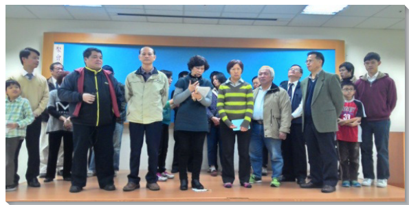
▲新人展覽，分享蒙恩見證

下半年福音節期開始前，弟兄們決意舉辦新路成全訓練，帶領眾聖徒有分福音行動。弟兄姊妹們熱烈響應，報名人數近兩百位。十一月初，我們於忠義會所舉行二天一夜之成全訓練。與會的聖徒得著開啓，更新心思，並且接受負擔，每人至少列出三位福音朋友的名單。訓練結束後，我們在集中禱告聚會時，同心合意在主面前屈膝迫切禱告，各區的活力小組更照著主的引導，逐一探訪名單上的福音朋友。十一月中至十二月底福音節期間，每週至少有三十五位聖徒出外叩訪，節期中首次主日聚會的參加人數，與前兩個月的平均人數相較，提高了三十位。聖徒們持續叩訪、邀約，接下來的五週，主日總人數再增加了二十位，