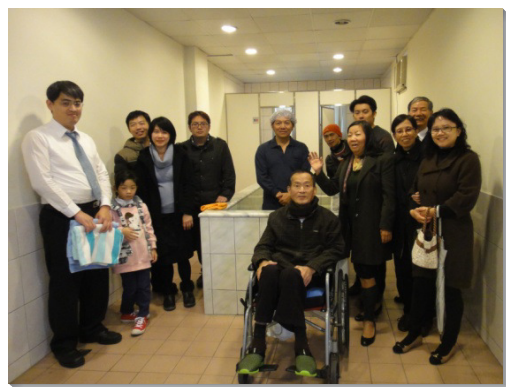
▲聖徒配搭出訪，喜樂領人歸主

主日晚上七點至八點。第一週為集中福音聚會，另兩次輪流由兩個區的聖徒主體配搭服事。每次聚集都有三至五位福音朋友參加，有些是聖徒們平日照顧的朋友，也有些是因著中午叩訪行動接觸到的朋友。自叩訪實行以來，已有許多福音朋友陸續得救，眾人一同歡呼喜樂。