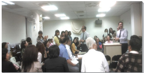
▲福音聚會中，聖徒介紹福音朋友

第二，關於校園的福音。近五年來，聖徒們打開家，有分鄰近華江高中的開展。去年由於學生人數增加，另一個家也打開照顧學生，並有訓練學員一同配搭。目前有八位學生聖徒穩定參加排聚會，其中兩位是今年纔得救的新人。此外，每週平均有三至五位福音朋