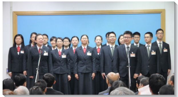
▲學員們向家人表達感謝的話

接著，有十八位學員逐一表達對家人感謝的話，他們發自內心的真誠，使在座眾人不禁感動落淚。許多家長和聖徒看見兒女的長進與變化，更為喜樂，其中三位學員的父母上台見證，讓兒女參加訓練，接受主手的製作，是人生中最上算的選擇。一位家長分享，在養育兒女的過程中，時感失敗懊悔，但他在其中學得祕訣，就是將孩子帶到召會生活中。在正常的召會生活裏，神的成分就得以分賜到孩子們裏面，使他們正確面對人生。