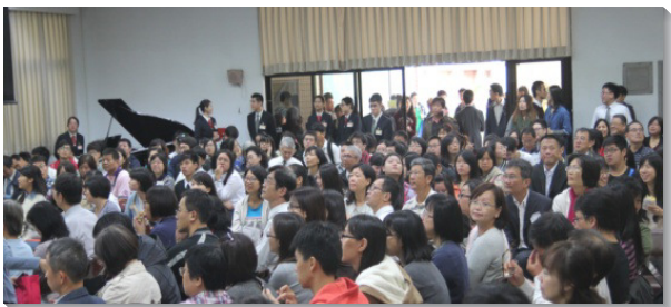
▲學員家屬與聖徒踴躍與會，現場座無虛席

會中，學員豪邁的唱詩，見證他們向著神呼召的堅定心志。並有八位學員分享，他們如何藉著訓練的幫助，在生命、事奉、基督的身體、性格等方面得著成全。一位姊妹見證，她不喜歡作整潔勞務，因此當她知道被分配到相關的專項服事時，心裏不禁埋怨。經過多次的交通與禱告，她看見，服事這些看似微不足道的事，其實就是事奉神，便願意學習忠信，像主耶穌一樣卑微服事。另一位弟兄分享，在開展的配搭過程中，主用基督身體的異象光照他，使他看見自己的驕傲。於是他向主禱告認罪，樂意受主對付，與人相調建造。最終，他與同伴的事奉帶進了主的祝福。此外，幾位結訓多年的聖徒分享訓練對他們在職場，以及召會生活中的幫助，使他們無論何往，都帶著雄心大