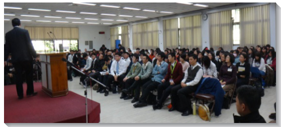
▲與會的大學聖徒專注進入信息

我們願更多經歷亞伯拉罕的神，以撒的神和雅各的神，而成為神的以色列，完成神的定旨。（王立中）