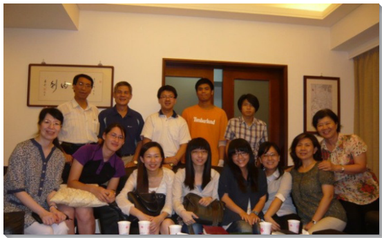
▲嘉興二區的聖徒們歡樂參加小排聚集

十六會所嘉興二區的聖徒們，積極跟隨召會的帶領，近一年半以來，區聚會人數從十二、三位，繁增至二十多位。我們蒙恩的關鍵，在於同心合意禱告與奉獻，在主前迫切尋求突破；並跟隨召會的帶領，操練實行神命定之路。