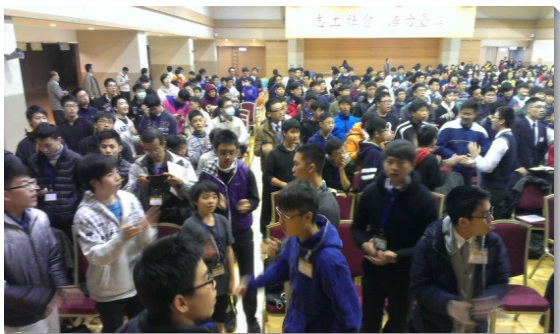
▲青少年聖徒彼此挑旺、歡唱詩歌

關於國中聚集，服事者幫助他們認識人的各部分，以及人各部分的功用，進而珍賞在人深處的『靈』，這靈乃是接觸神、接受神的器官。接著，教導他們辨別