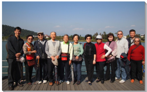
▲聖徒至梅花湖相調