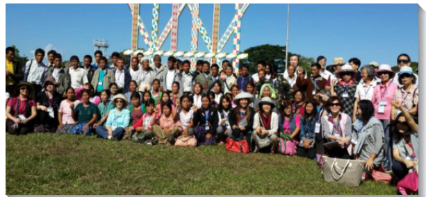
▲與緬甸眾聖徒合影

接著，我們登上高塔，全境美景盡收眼底，眾人不禁高聲頌讚，讚美主的名在全地何其美，齊聲禱告，願祂的名在這地被尊為聖，願祂的國來臨，願祂的旨意行在這地，如同行在天上。在禱告的靈裏，我們喜