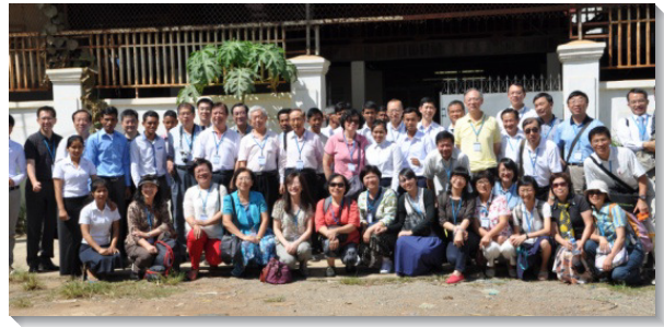
▲與柬埔寨眾聖徒合影

目前柬埔寨有十一處地方召會，共四百位聖徒。聖徒們年紀雖輕，愛主之心熱切，服事也老練，特別積極廣傳福音，無畏環境艱難，並鼓勵大學生至鄰近鄉鎮開展，使許多學生受到成全。我們訪問金邊、馬德望、磅清揚和暹粒等四處召會，各處聖徒的見證十分激勵人心。弟兄姊妹們所處的環境有諸多缺乏，但卻分外殷勤、樂意為主擺上。許多弟兄姊妹得救年日並不長，服事的度量卻一再被擴大，為主勞苦並照顧召會，誠如使