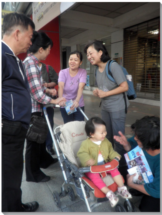
▲學員向路人傳揚福音

由於台北街頭路人來去匆忙，輔訓幫助我們，學習在一分鐘之內，簡潔地向人傳講人生的奧祕。經過多