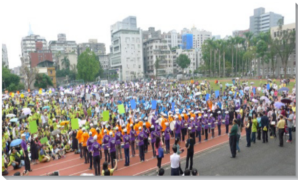
▲中區、南一區青少年鼓隊展覽

當日中午，身著各色大會活動服的青少年成群湧入附中校園。為使會程流暢進行，大會服事者們將所有報名會所分成三個大隊，每隊各按次序輪流參加福音聚會、體驗活動和相調展覽大會。