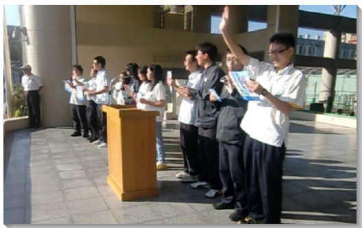
▲師大附中弟兄姊妹於朝會時邀約全校同學參加大會

藉著與活力同伴禱告，我們從主領受負擔，不僅邀約熟識的朋友，更要將邀請卡送到班上每一位同學手中。一位姊妹流淚禱告，主光照她要還福音的債，她便邀請了從小至今所認識的每位中學朋友。一位高三弟兄原以為同學不可能撥空參加，但他看見需要住在主裏結果子，便利用課堂報告時邀約全班。同伴們的見證彼此激勵，十七會所的聖徒們也迫切禱告，讓我們福音的靈越發火熱，加印四千張大會邀請卡，到鄰近的高國中校門口發單張，還陪同國中排的弟兄姊妹去邀約同學。