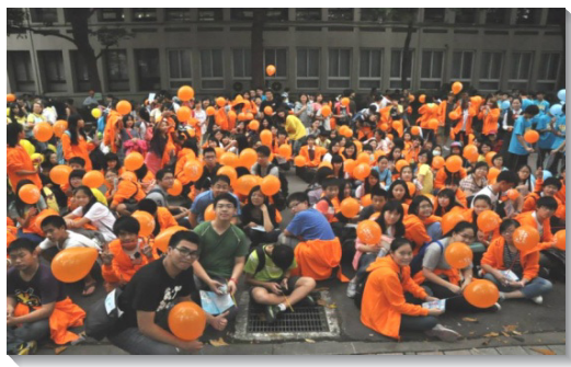
▲青少年與同伴們喜樂與會

不僅如此，主日、小排聚集、通訊軟體和網路上，各處可見弟兄姊妹們分享與會或邀約的蒙恩。一位中學姊妹分享，她很喜樂能為主盡一分力，藉這次機會向眾人表明基督徒的身分，傳福音給同學們。有位在職聖徒說，原先覺得青少年活動與他無關，但聚集中服事者多次傳輸負擔如同主的說話，他轉向主，向主