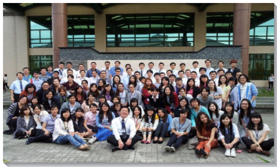
▲於中部相調中心參加成全訓練

去 年四十三會所成立之初，弟兄們交通到兩個主要的負擔：第一，關於召會生活的生態，恢復弟兄姊妹操練靈和彼此相調的生活。第二，關於召會生活的架構，重建活力組與小排的實行，讓人人盡功用，全體都事奉。