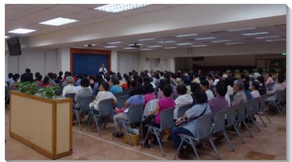
▲參加聖經導引組的弟兄姊妹專注聽講

延續上半年的課程，開訓當天，弟兄們再次傳輸追求的負擔所在，讓我們備受吸引，真願全享各班內容的豐富。生命讀經班本期將進入雅歌至以賽亞書；使我們藉著享受生命的話，有生命的經歷，在生命中同被建造。聖經導引班將追求利未記，啓示神的子民需要藉著基督作祭物的實際而敬拜神，過聖別，潔淨並喜樂的生活。基要真理班繼續使用真理課程，往前進入一級卷三和卷四課程，論到神完整的救恩。主的恢復