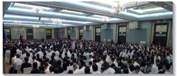
▲訓練中弟兄們與會盛況