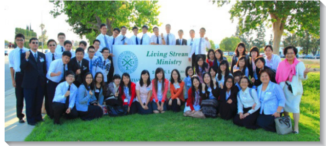
▲中區學生與服事者們於水流職事站

夏季訓練的主題是創世記結晶讀經，向我們揭示神的願望和定旨，是要得著一個團體人，有祂的形像彰顯祂，並有祂的權柄代表祂。為此我們需要在生命上長大，天天享受三一神作我們的生命樹和生命水。我們每天早晨六點半在喜瑞都召會操練禱研背講，各地聖徒追求真理的渴慕，使我們同受激勵。訓練期間，來自全球的聖徒，在一個新人的感覺裏，逐一交通主在各地的行動：歐洲開展、以色列開展、美國眾召會的開展、全時間訓練、網絡福音與路加聖徒行動等，拔