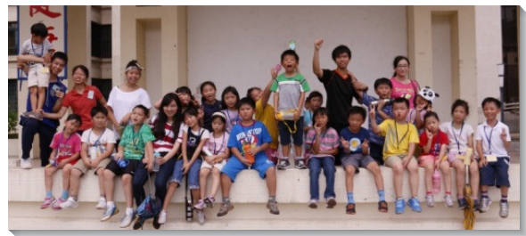
▲服事者與孩童們在北護校園戶外活動留影

感謝主，在主裏的勞苦不是徒然的，孩子們因著品格園的幫助開始改變。起先有幾個孩子會彼此抱怨、定罪，漸漸能彼此鼓勵、幫助。有的孩子回家後願意幫忙父母作家事；有的孩子原本只打算參加一週，後來願意繼續參加；也有家長關心如何延續品格園的培育。我們仍需禱告，求主給服事者殼用的恩典與智慧，將小朋友服事到主面前，也使孩子們與家長能進入活力排，求主祝福祂的召會。（王海容）