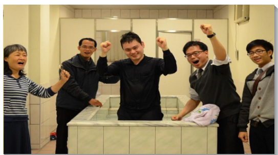
▲弟兄姊妹外出後遇到平安之子

自去年三月起，一會所聖徒操練每週主日外出叩訪，今年開始將時間從晚上改為下午四點到六點，或叩門，或在路上傳福音接觸人，主要負擔是建立聖徒『福』架構的召會生活。主祝福我們，平均有三十多位聖徒建立週週外出訪人的習慣，無論陰晴風雨，都堅定持續。加上開展隊學員的扶持，聖徒們在規畫、研討、配搭、叩訪及傳講上都有長足的進步，也恢復並