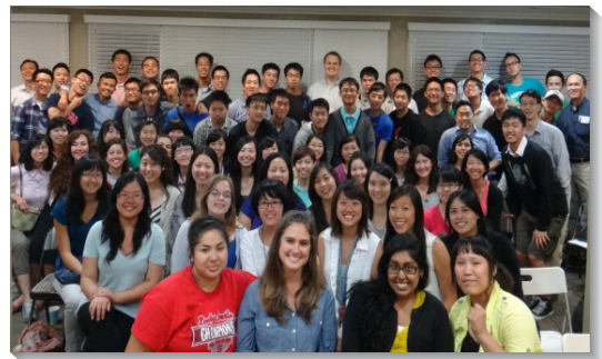
▲南一區學生們在 UCLA 與聖徒相調

第二週開始為時六天在安那翰的夏季訓練。每天早上，我們與其他來自台北南二區、花蓮、台東和北卡羅萊納州的聖徒一同在哈崗召會複習，以中英文分組禱讀信息綱目和研討思路，然後各組集中抽考。許多學生因操練用英文申言，並於主日申言聚會時鳥瞰各篇信息，放膽而有突破，被真理構成。另外，部分聖