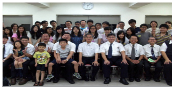
▲畢業生與家長、服事聖徒合影

家長、服事者及同過召會生活的弟兄姊妹們，將對畢業生的祝福與鼓勵錄製成短片播放。片中訴說父母