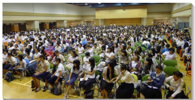
▲青少年在會中聆聽信息

最後一天是集中聚集，弟兄向眾人傳輸北部眾召會青少年大會的負擔，盼望青少年邀約同學、新人赴會，一人邀兩位同伴參加。願特會中的話語，成為青少年長久的幫助，使他們剛強壯膽，傳揚福音！（曾之尋）