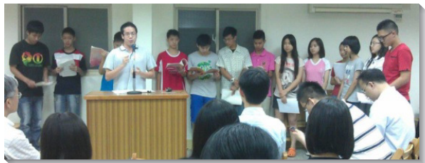
▲青少年弟兄姊妹向眾人分享特會蒙恩

在高中生的部份，一位第一次參加特會的高中弟兄見證，看見會中眾人喜樂唱詩並用靈阿們，讓他印象深刻。信息說到要操練作精明的童女及忠信的奴僕，激勵他為主擺上，寶愛召會生活。另一位剛升上大專