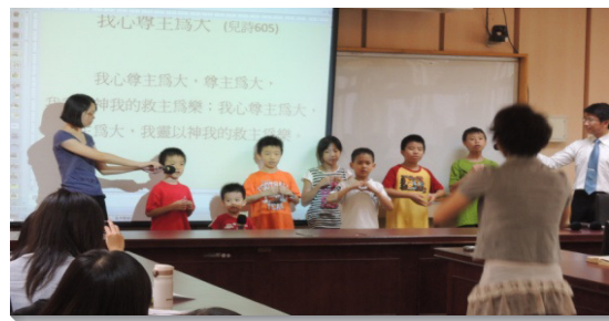
▲三十八會所兒童於集中主日時展覽詩歌

接著，為成全青職聖徒在召會中盡功用，我們開始每主日早晨擘餅聚會前的事奉成全聚會。前半段追求書報『建造神家的事奉』及『啓示的事奉』，認識事