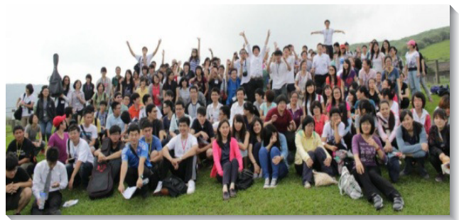
▲與會聖徒在擎天崗向主歡呼