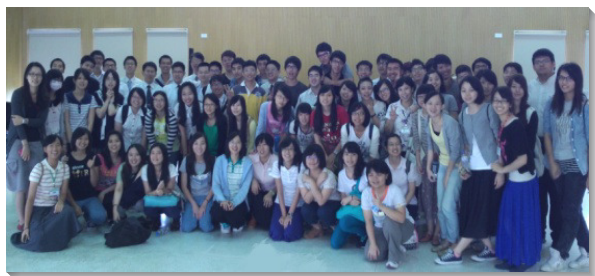
▲大專聖徒於特會結束後合影

大專期末特會第二梯次於六月二十九至七月一日在宜蘭舉行，特會主題為今年國殤節特會信息『保羅的完成戰事』。本召會七個會所與桃園眾召會七十多位大專生與會，學生聖徒在主日一同擘餅記念主，並在活動中喜樂相調。