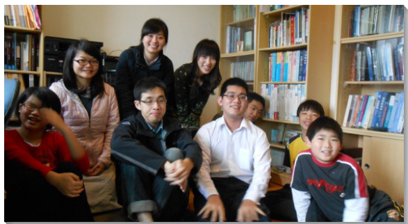
▲三十會所聖徒家中聚會

根 據統計，南二大區原十三會所增出的六個會所，總計七個會所，每年至少到會一次的約一萬零三百人，若扣掉經常聚會的四千多人，至少還有六千多人需要餵養與照顧。主曾說，『你們要去，使萬民作