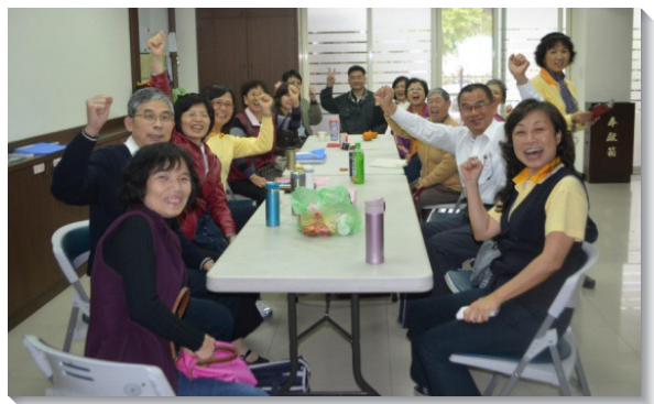
▲壯年班學員前來七、四十一會所配搭開展

開展中雖然也有被拒絕的時候，但我們只管去，主就將平安之子賜給我們；因為我們的去就是一個憑藉，使主有機會進到福音朋友裏面。藉著這樣外出，聖徒們嘗到了傳福音的喜樂，有幾位更天天前來配