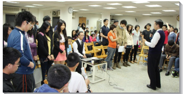
▲福音聚會末了朋友們禱告接受主

分組讀經時，我們和福音朋友一同進入約翰福音九章『瞎眼人的需要』，看見我們的人生雖然忙碌，卻常是茫然、缺少方向，就像瞎眼一樣。主耶穌將唾沫和泥，抹在瞎子的眼睛上，瞎子照著主的吩咐到池子裏用水洗，便得以看見。這表徵我們只要信而順從，就能得著生命的光，享受主生命的牧養。當晚一位穩定參加五會所校園小排的同學，就是這樣簡單的在受浸時禱告：『主耶穌，我相信你，我要得救』，令人感動，願主記念與會的朋友，讓生命的話在他們心裏發芽長大，在豫定的時期得著他們。（鄭甯愛華）