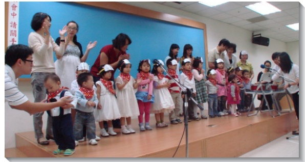
▲十三會所兒童排展覽

當日的展覽由青年隊輔的詩歌帶動唱揭開序幕；他們個個動作整齊，靈裏高昂，吸引小朋友認真投入。青年隊輔的簡短見證，也讓父母看到，孩子若在召會中成長，被神牧養，將如何蒙保守、被祝福。接著，我們播放了這一年來兒童活潑可愛的照片集錦。然後