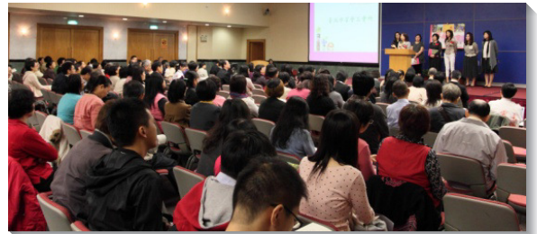
▲各會所服事者分享見證

中壢召會一位姊妹見證，因著朋友邀約一同種菜，她體會到撒種前有些重要工作，例如：翻土，整地，除草，挖去大小石頭等，都是為了讓土地成為肥沃的好土。她感謝主給她看見，藉生命教育豫備學子的心土，就使他們能對信仰作出正確的選擇。