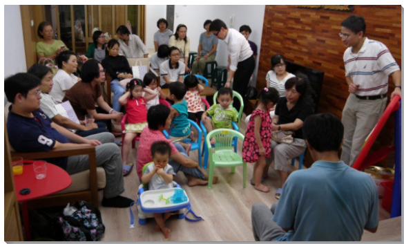
▲二十三會所幼幼排

九月時，先後又有十五位聖徒帶著二位兒童，前往十二、三十七會所觀摩，實際參與他們的兒童排。弟