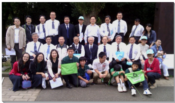
▲東京福音行動第六小隊合影

十月八日起，日本眾召會舉辦了為期三天的『歡樂禧年』福音節期，盼望將近三年受浸的新人一同帶來過節，並與台灣的訓練學員，及結束國際長老及負責弟兄訓練的弟兄們，一同配搭，展開福音行動。