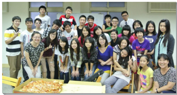
▲四十五會所青少年福音茶會