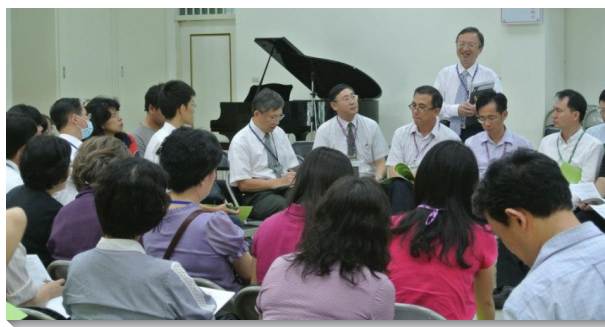
▲弟兄姊妹分組交通

晚餐後是第三場聚會，按年齡分為三組交通：中壯年組、在職組及校園開展組。中壯年組中，許多聖徒分享到參加壯年班訓練的蒙恩，還有鄉鎮開展、海外候鳥式移民開展等見證。在職組的聖徒則分享他們如何傳揚醫界福音，得著許多同事及病患信入主，並一同進入召會生活。令人大得鼓勵的是，如今在花蓮慈濟醫院也有了許多主剛強的見證人。校園開展組則著重於青年福音。聖徒們交通到他們藉著禱告得著人、牧養人並成全人。台北十四會所的聖徒甚至說，他們以整個會所的力量來服事陽明大學和台北榮總，所有弟兄姊妹都成為路加聖徒的後盾。