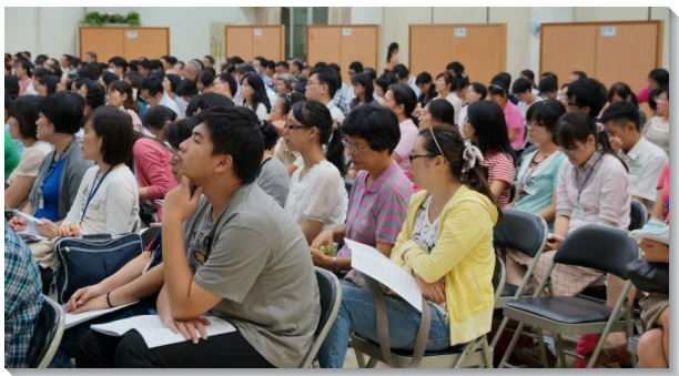
▲路加集調在台南裕忠路會所舉辦

八月十八日週六中午，弟兄姊妹陸續從各地抵達。報到後，眾人便一同享用午餐，彼此相調、交通。下午二時，我們在禱告聲中開始了第一場聚會。在這場聚會中，聖徒們分為醫院組、開業組、學生組、眷屬組、服事者組及其他組有交通。弟兄姊妹根據服務單位與配搭性質的不同，在小組中分享了蒙恩的見證，以及如何在職場傳揚福音等。路加聖徒平日工作大多非常忙碌，眾人同有一個感覺：離了主，我們不能作甚麼。享受主、與同伴一起過小排、禱告生活，是我們服事病患的動力來源。有一些弟兄姊妹也見證他們在工作場所時常唱詩、發送福音單張，藉著與聖徒配搭，在神的愛中服事病患，因此結了許多果子。