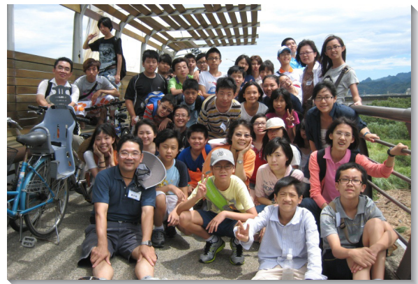
▲十六會所青少年相調

第一天，我們參觀了草莓文化館、台灣油礦陳列館及五穀文化村。第二天我們騎乘自行車遊覽黃金小鎮。