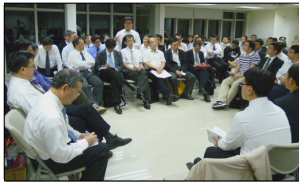
▲各會所青職服事者與聯絡人交通

接著的交通中，一位服事者題到，對青職弟兄姊妹來說，最重要的是『生活中的相調』，無論是戶外活動或一同用餐，都只是一個憑藉。相調需要屬靈，我