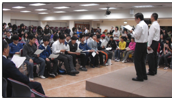
▲國中福音聚會實況

接著有三組青少年分享在召會生活中的見證。有位弟兄說，他從小在召會生活中長大，小時參加兒童排，現在參加少年排。主一直在生活中與學校裏帶領他，他對主不只有客觀的認識且有主觀的經歷。另一位弟兄也交通到，主是又活又真的一位。甚至當他被流浪狗攻擊時，也藉著呼求主名，免於受傷！