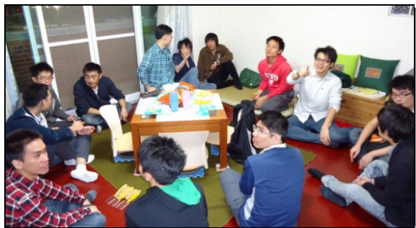
▲政大弟兄邀請同學至弟兄之家福音愛筵

已 過三月十八至三十一日在政大校園有為期兩週的福音節期。為此，四十二會所學生弟兄姊妹從開