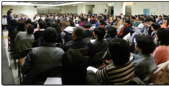
▲三十七會所週六晚上青年聚會

在這末後的世代，我們要運用各種智慧來傳揚福音，把青年人從世界救出來。盼望召會中的青年人在質和量上都被加強，成為建造召會的材料。（石虔如）