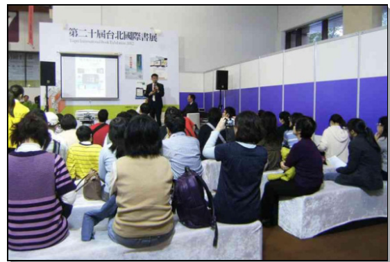
▲『基督徒出版雲端化解決方案』演講現場

在『召會分項事奉的建立』一書中，李弟兄曾題到，『真理不可改，但傳福音的作法可以改。』他也說，『傳福音的方法必須跟上時代。』二月五日下午三時，書房在書展會場發表演講，主題是『基督徒出版雲端化解決方案』。隨著數位化時代來臨，閱讀介面展現出有別於以往的多樣面貌。根據統計，二〇一一年全球智慧型手機銷量超過四億支。聚會中，常見聖徒沒有攜帶聖經及詩歌本，卻帶了手機。有鑑於此，書房近年來推出多項電子影音出版品，包括結合手持裝置的行動電子書，結合雲端技術的隨身數位福音棒、兒