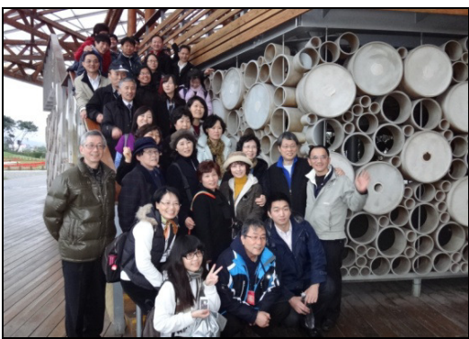
▲聖徒們一同外出相調

起初聽到弟兄們報告這次華語特會接待的需要時，我並沒有打算把家打開。但當弟兄們再次交通到這個負擔時，聖靈就感動我；在與弟兄交通後，決定把家打開來接待聖徒。