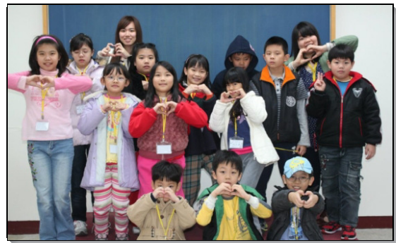
▲參加品格園之兒童與服事者合影

主說，『讓小孩子到我這裏來，不要禁止他們』（太十九14）。願主繼續祝福兒童品格園，藉這機會得著更多兒童及家長。（林復興）