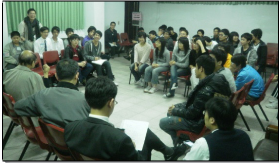
▲特會期間服事者交通

高 國中寒假特會於已過一月十八至二十日在關渡的台北城市大學舉行，約有七百位青少年與服事者參加。高中特會的主題是『生命的認識與生命的經歷（下）』，信息內容包括重生與清理舊生活、奉獻、對付罪與世界、對付心與良心、藉著讀主的話並禱告