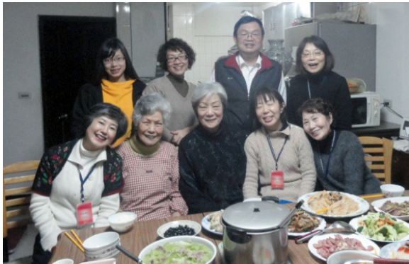
▲聖徒於家中用餐交通

為 迎接國際華語特會的到來，中區各會所在之前的現場訓練就有相關的豫備，如練唱標語詩歌、接待家庭的服事交通等，以期能和海外眾聖徒一同享受並經歷基督身體的豐富和實際。