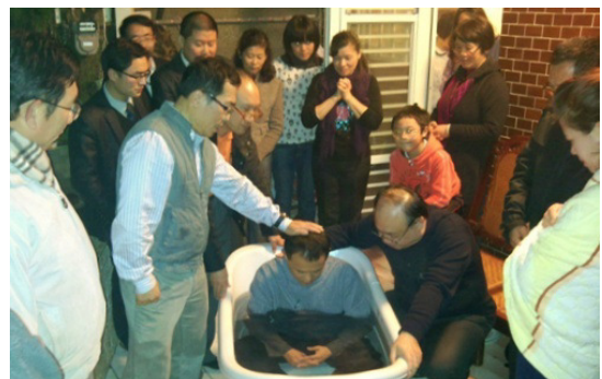
▲弟兄們為來訪的福音朋友施浸

特會結束當晚，我們在聖徒家中愛筵來訪的聖徒，共有七十幾人一同聚集，客廳幾無多餘的空間。當唱起第一首詩歌時，聖靈厲害的摸著那對夫婦，他們當下決定受浸成為神的兒女！阿利路亞！眾人高聲讚美並將榮耀歸與神！耶和華的作為是何等奇妙！（劉俊良）