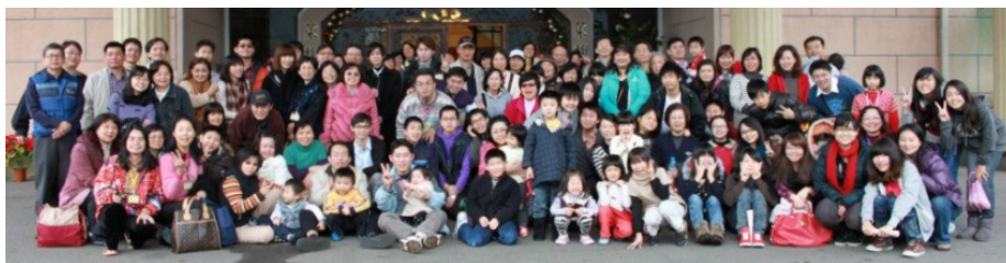
▲三十會所聖徒一同至新竹關西相調