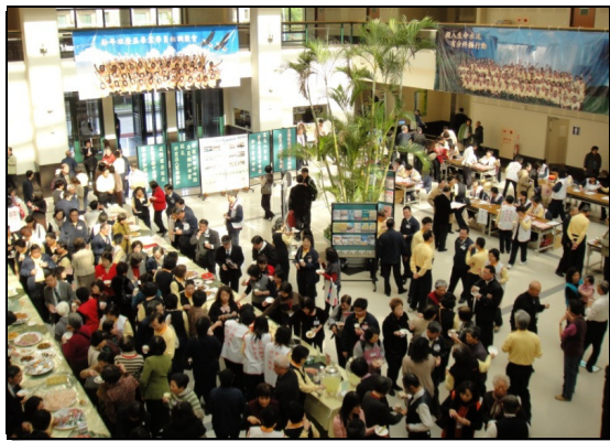
▲弟兄姊妹於茶敘時間熱絡的交通

第二天的畢業聚會更是盛況空前，與會人數超過一千五百位。首先介紹本期八十四位經過一年成全的畢