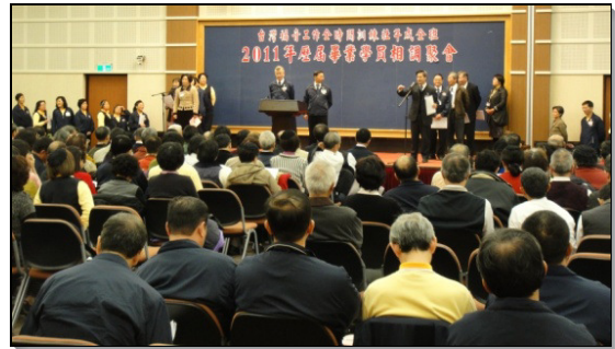
▲台島鄉鎮及海外開展見證交通

十四位學員的蒙恩見證，展現這一年來主在他們身上的調整與製作。有的見證藉著操練起居規律的生活，身體逐漸恢復健康；藉著操練午禱並接受教師們的分賜輸供，靈與魂都得甦醒，對結晶讀經也有了珍賞並進入。有一位姊妹得救半年就來參訓，卻在訓練的八個月中結了十六個果子；她原本個性內向，不會