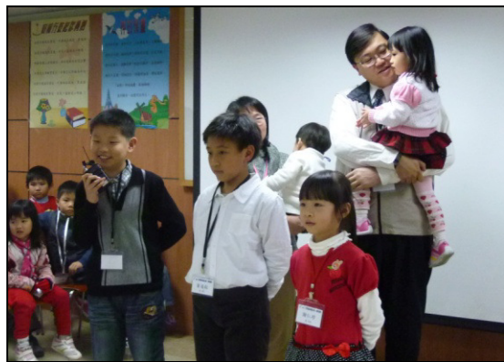
▲兒童及家長於聚會中分享見證

這次活動以聖經中『剛』的榜樣一大衛為主題，藉著故事、詩歌，傳達他在幼年時完全倚靠神，不害怕歌利亞，我們也要學習在各種環境中，到主面前尋求勇氣和力量。此外，兒童個個在眾人面前述說自己以前如何固執、被動、膽怯，卻透過主的話，明白要剛強不剛硬，要主動不被动，要壯膽不害怕。召會是成