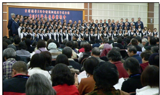
▲畢業學員詩歌展覽

聚集最後有家屬代表對壯年班的肯定與感恩，還有教師們對學員勉勵的話。弟兄語重心長的囑咐：畢業不是訓練的結束，乃是另一個訓練的開始。學員們要繼續過祭壇和帳棚的生活；祭壇的火不可熄滅，要繼續焚燒、發光、照耀！回到各地要顯出功用，作撒種者、栽種者、澆灌者、生育者、餵養者以及建造者，成為各地召會的祝福。 (洪鍾莉莉)