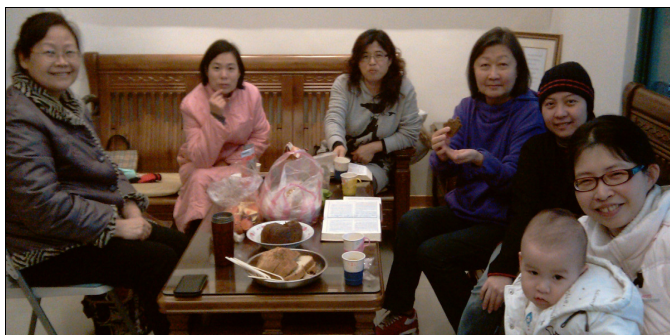
▲二十七會所週間喜樂洋溢的姊妹聚集

這群配搭的姊妹們，也是在萬芳國小生命教育的志工老師。她們常在一起交通與研討，期望能將週五晚